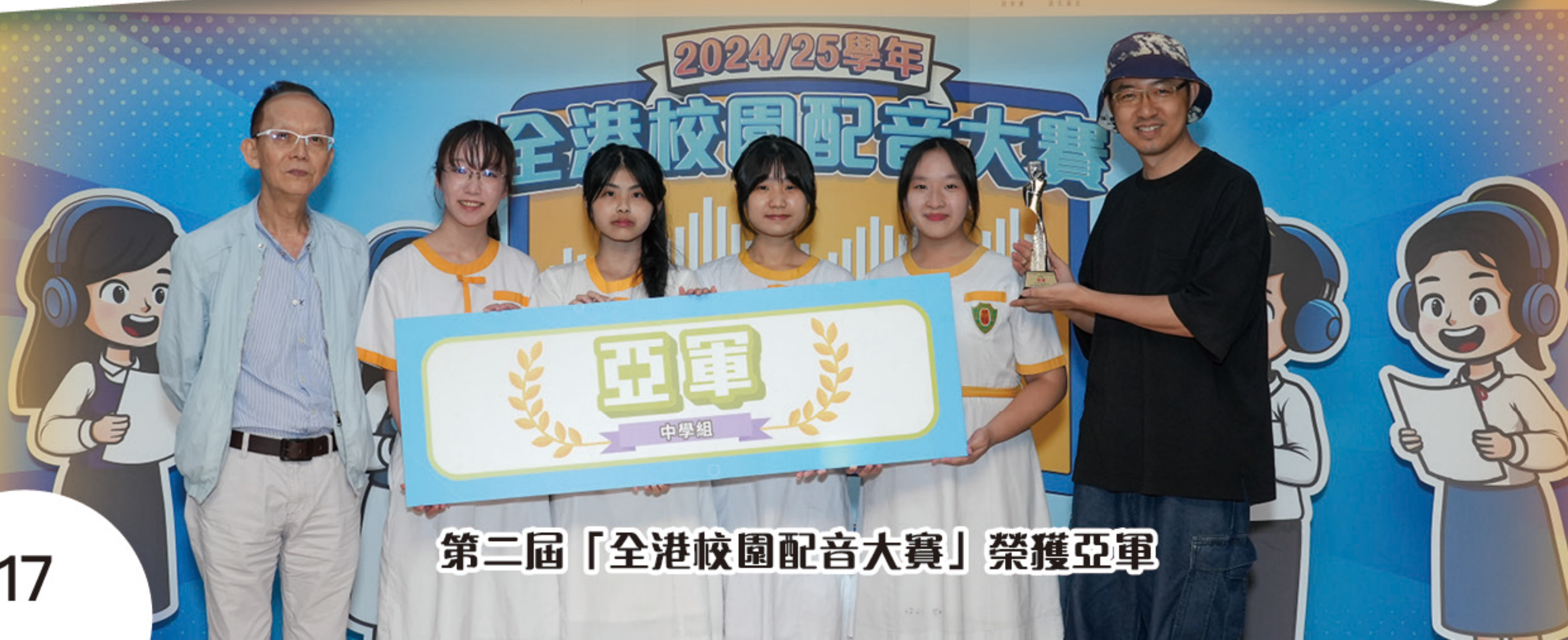
第二屆「全港校園配音大賽」榮獲亞軍