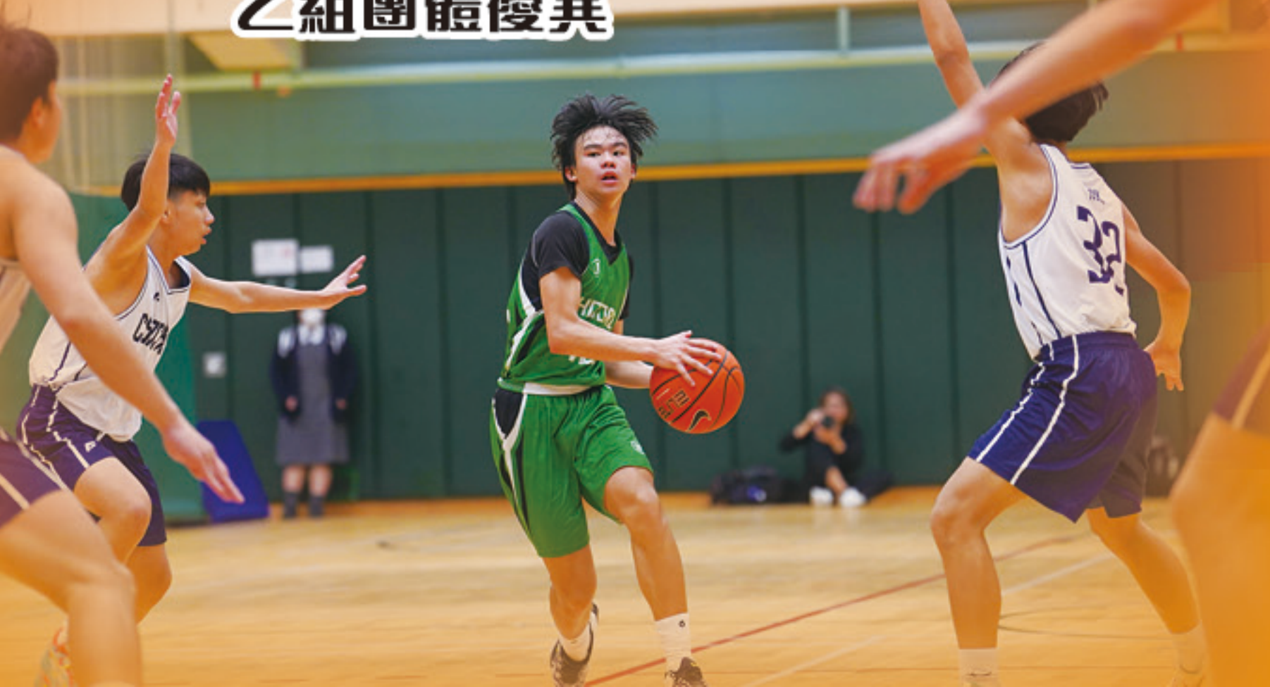
元朗區中學校際男子籃球乙組團體優異