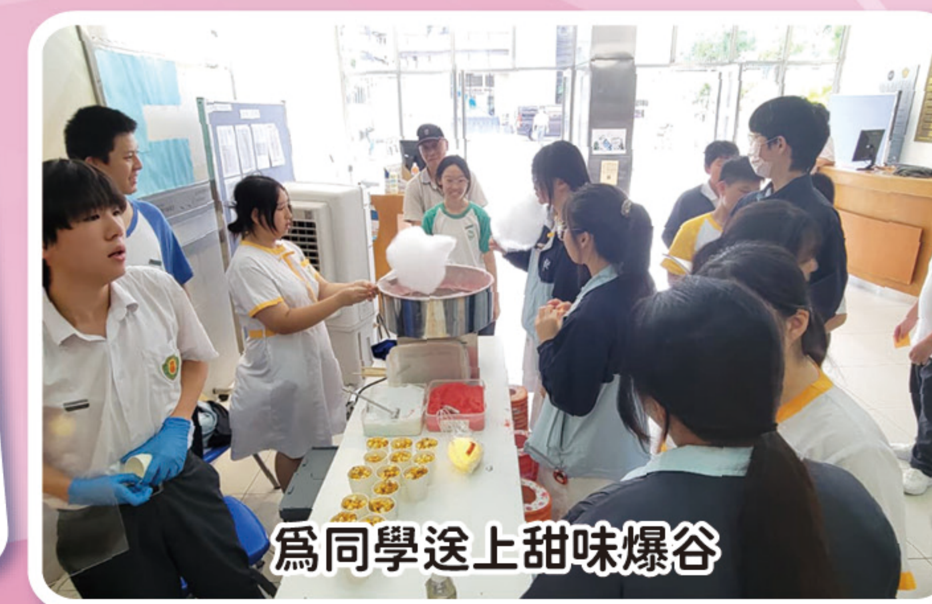
為同學送上甜味爆谷