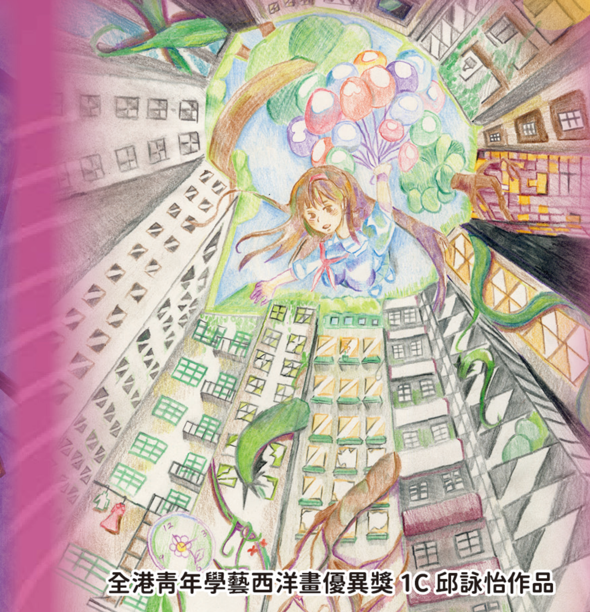
全港青年學藝西洋畫優異獎 1C 邱詠怡作品