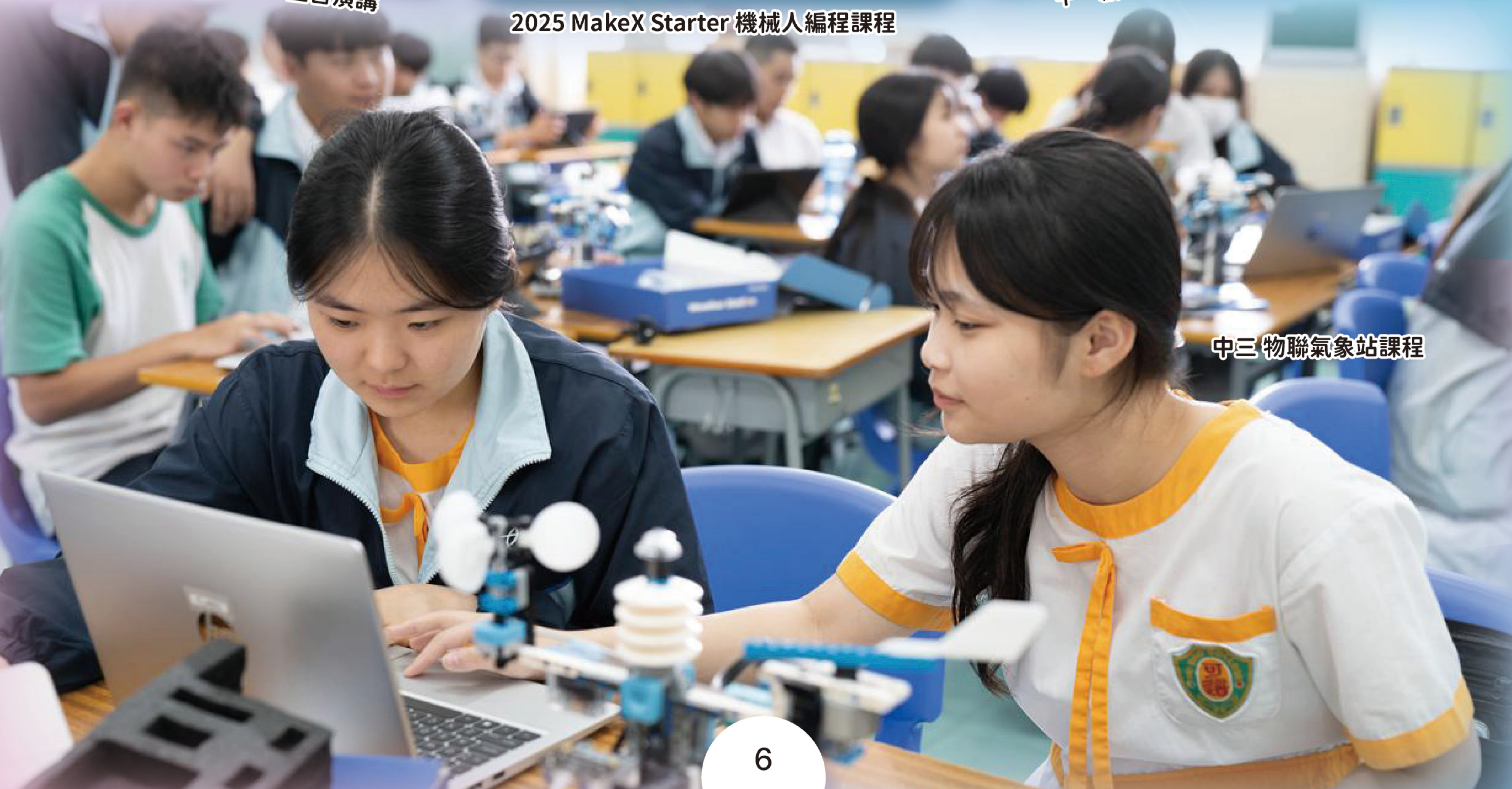
中三 物聯氣象站課程