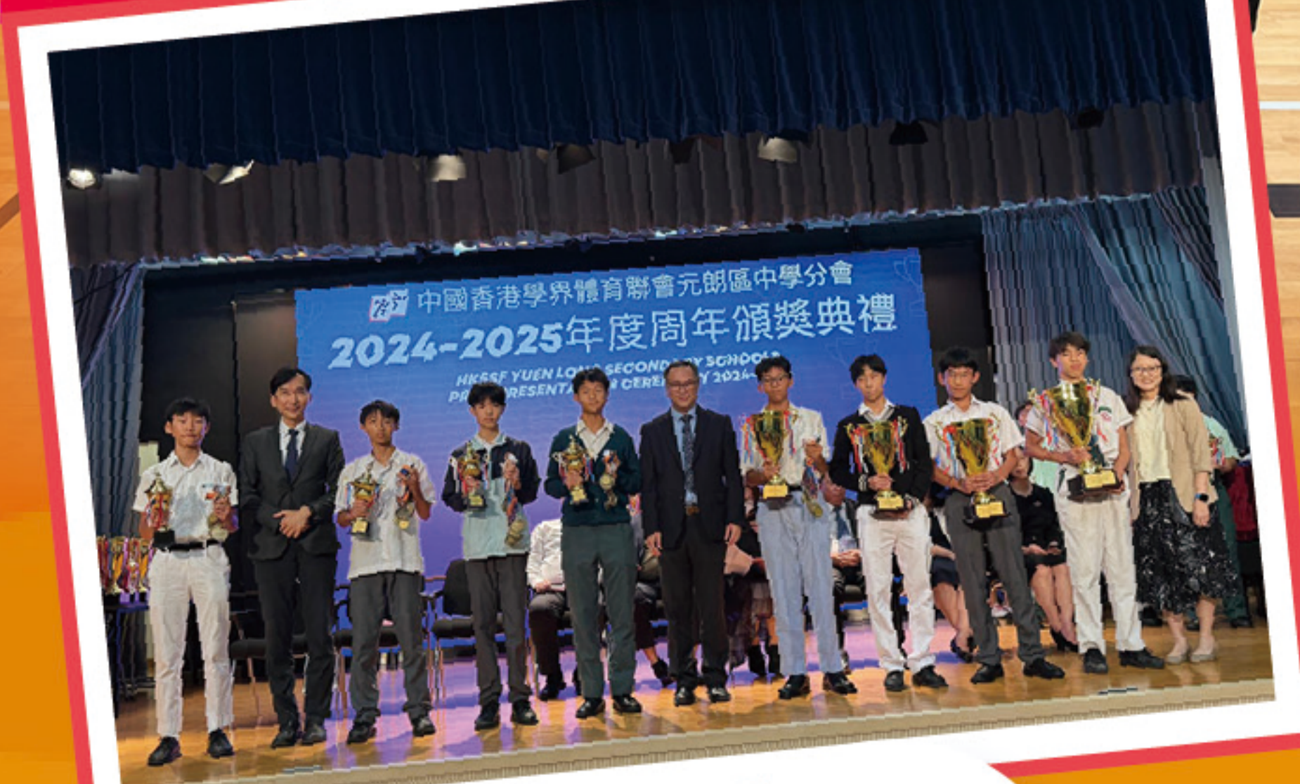
元朗區中學校際排球比賽 男子丙組團體優異