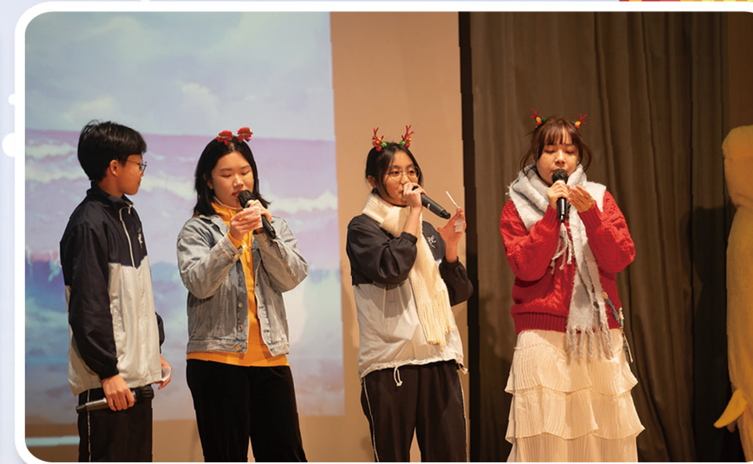
班主任與同學一同合唱