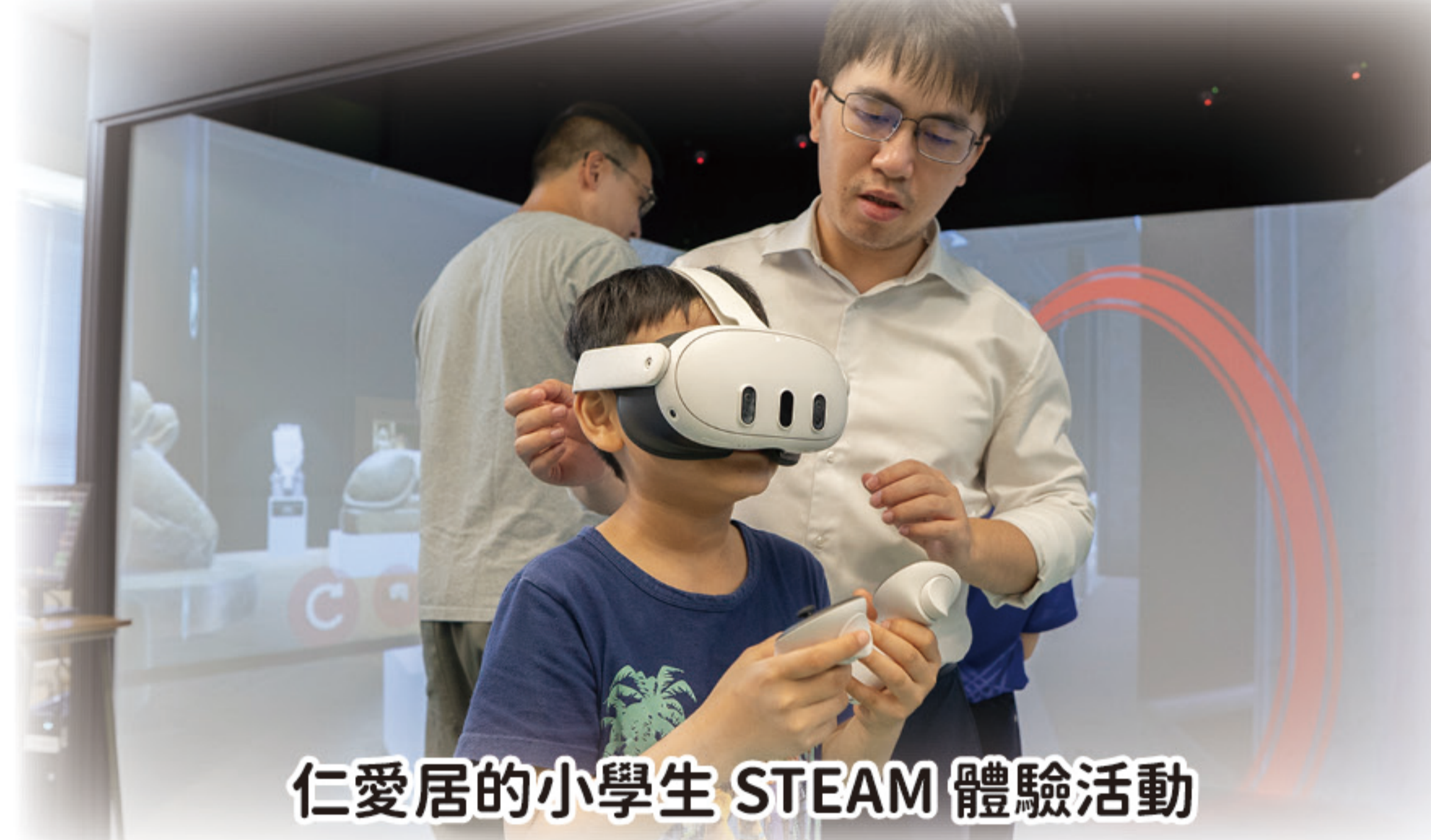
仁愛居的小學生 STEAM 體驗活動

在長者服務方面，番色園可道長者學苑為區內長者舉辦了四個不同類型的工作坊，不僅豐富了社區互動，更進一步加深區內人士對本校的認識與支持。