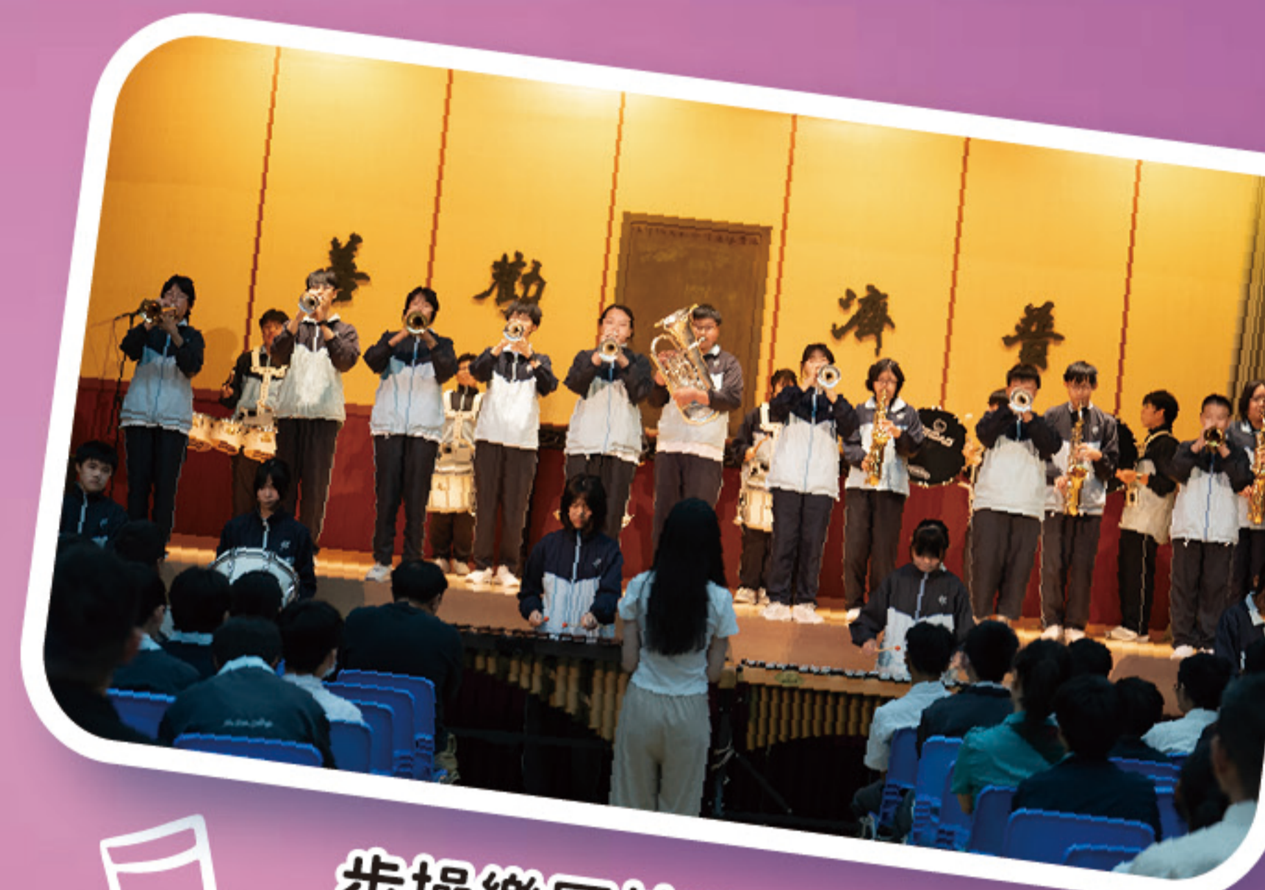
步操樂團校內演出

本校著重學生的多元化美育發展，音樂科設立合唱團、步操樂團及中樂團。三者平日皆有恆常訓練，在陸運會及學習成果分享會中表演，以爭取演出經驗，提升技巧。本年度步操樂團參加了香港學校步操樂團公開賽 2025，取得銀獎，成績理想。