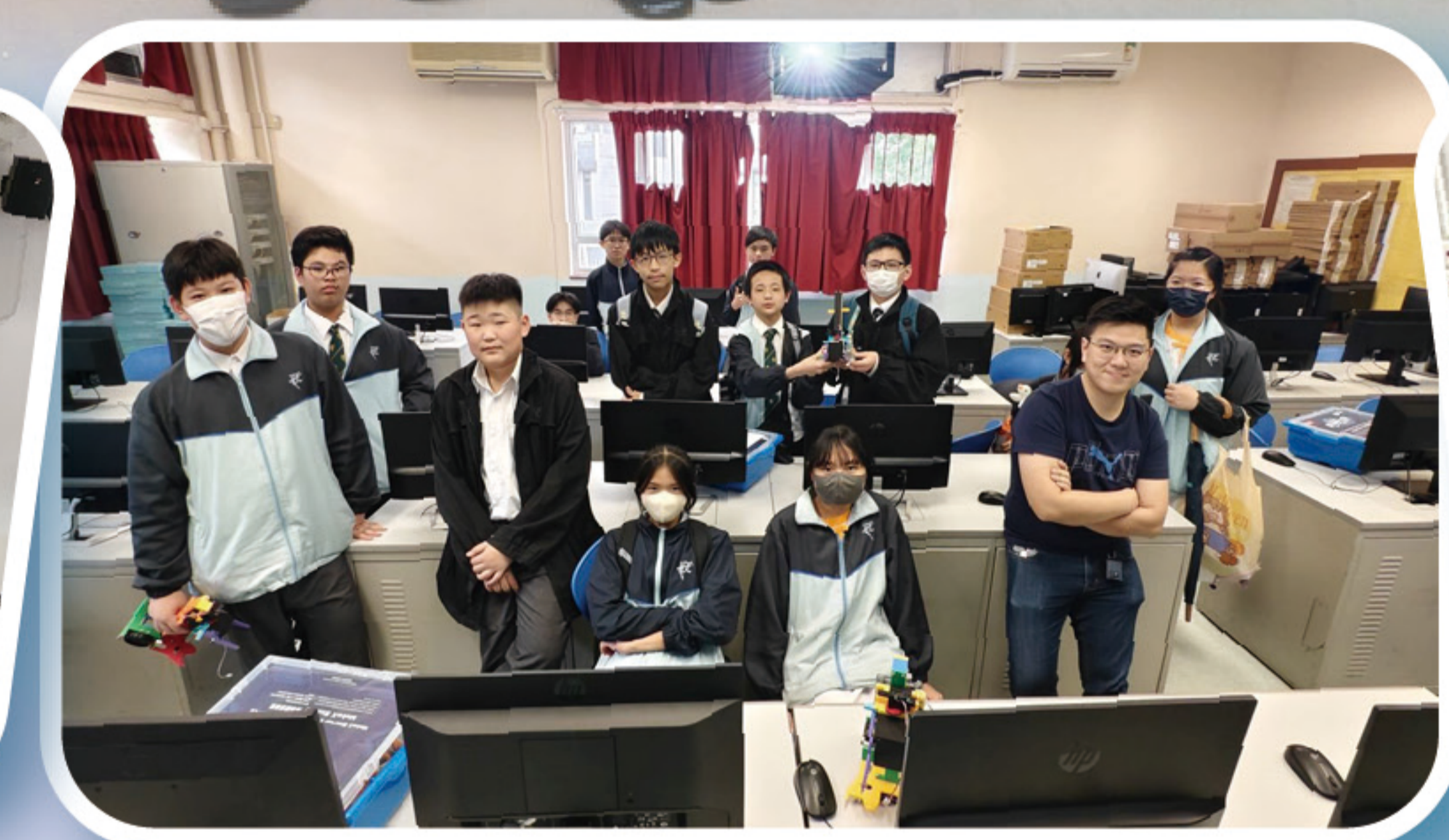
2025 MakeX Starter 機械人編程課程