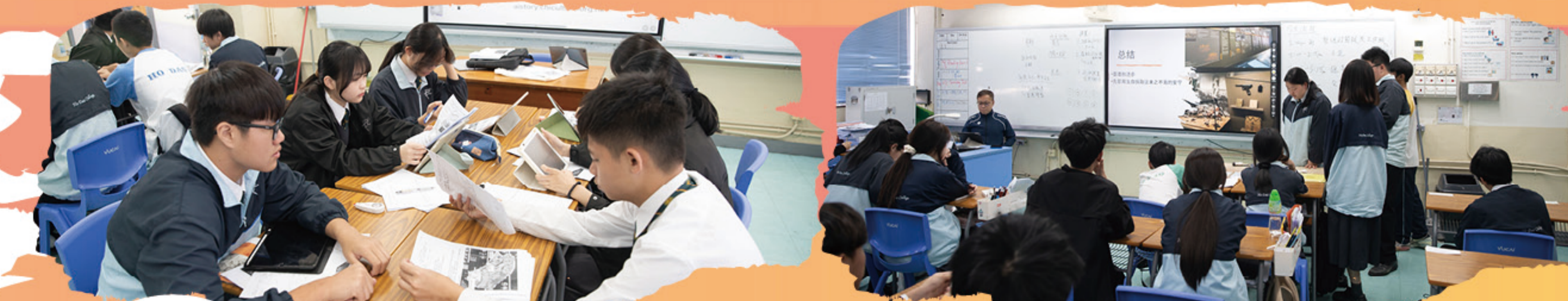
同學用心整理學習資料

各級同學在課室分組，就學習及探究所得的知識作整理及匯報進行交流，並選出班代表於禮堂向初中級同學分享學習成果及感受。