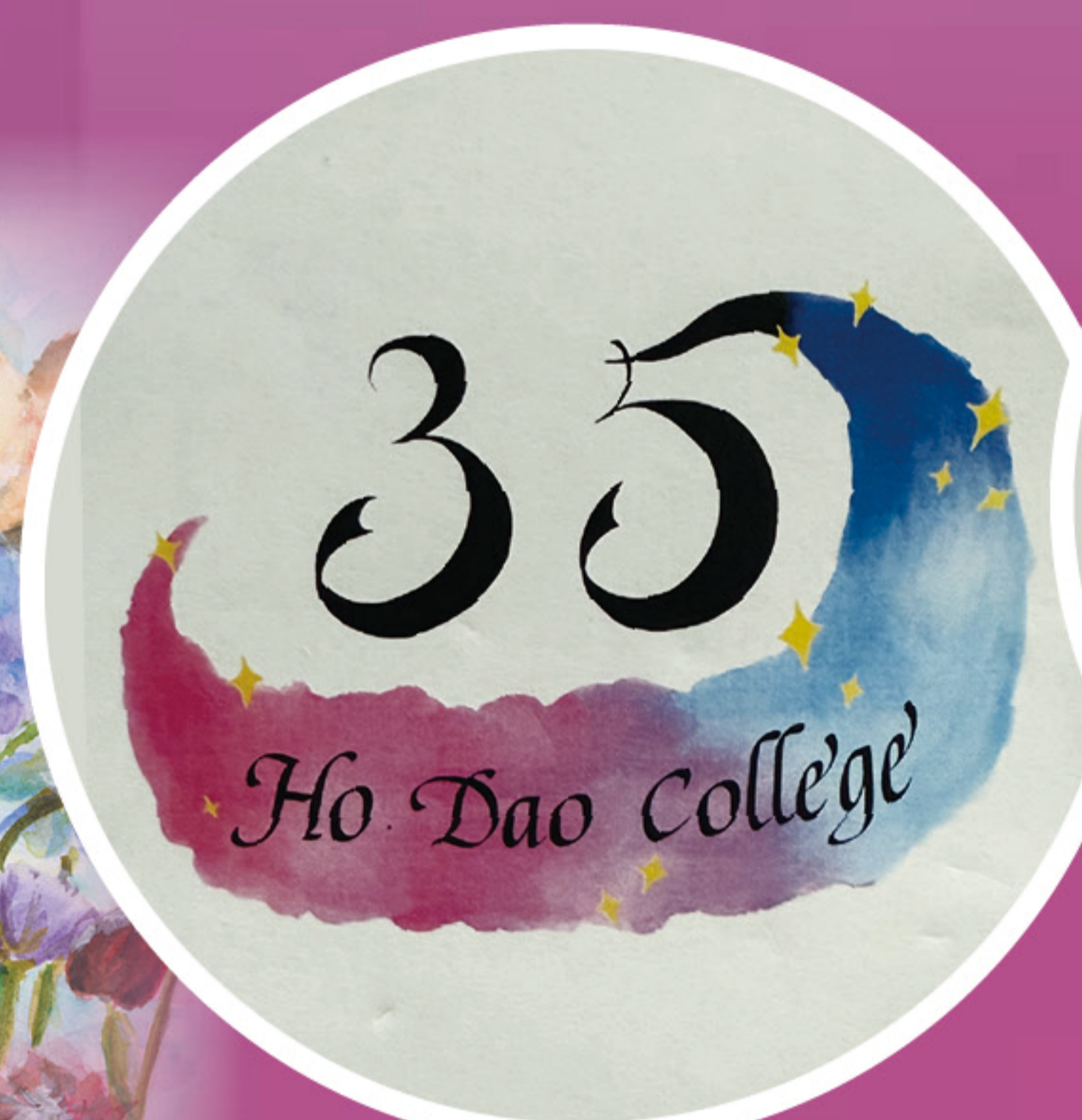
35周年校慶標誌 最受同學歡迎獎