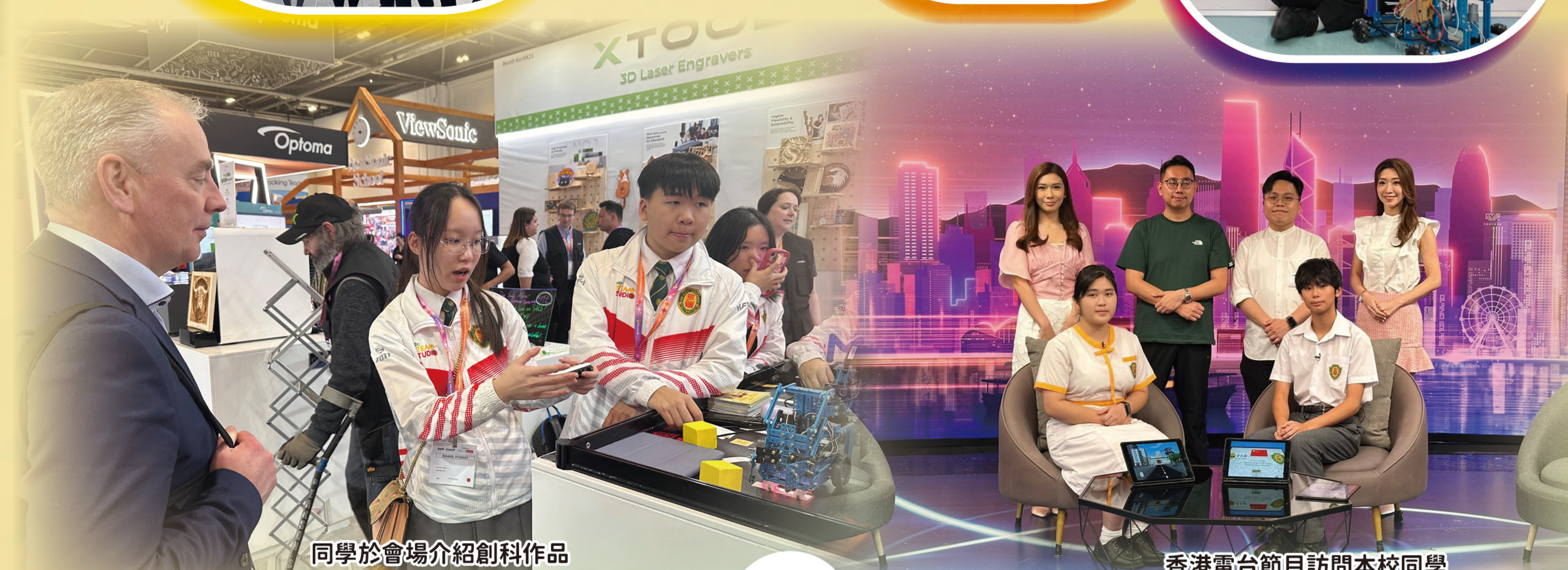
同學於會場介紹創科作品