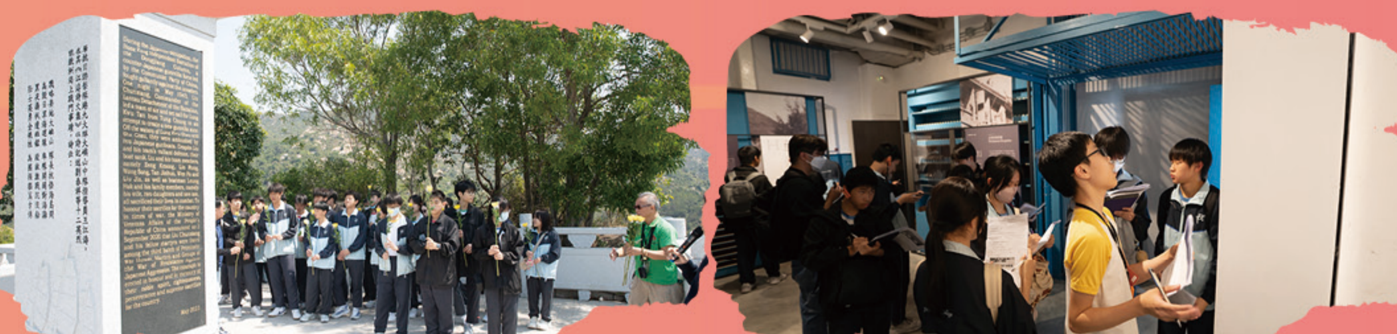
同學獻花向抗日烈士致敬