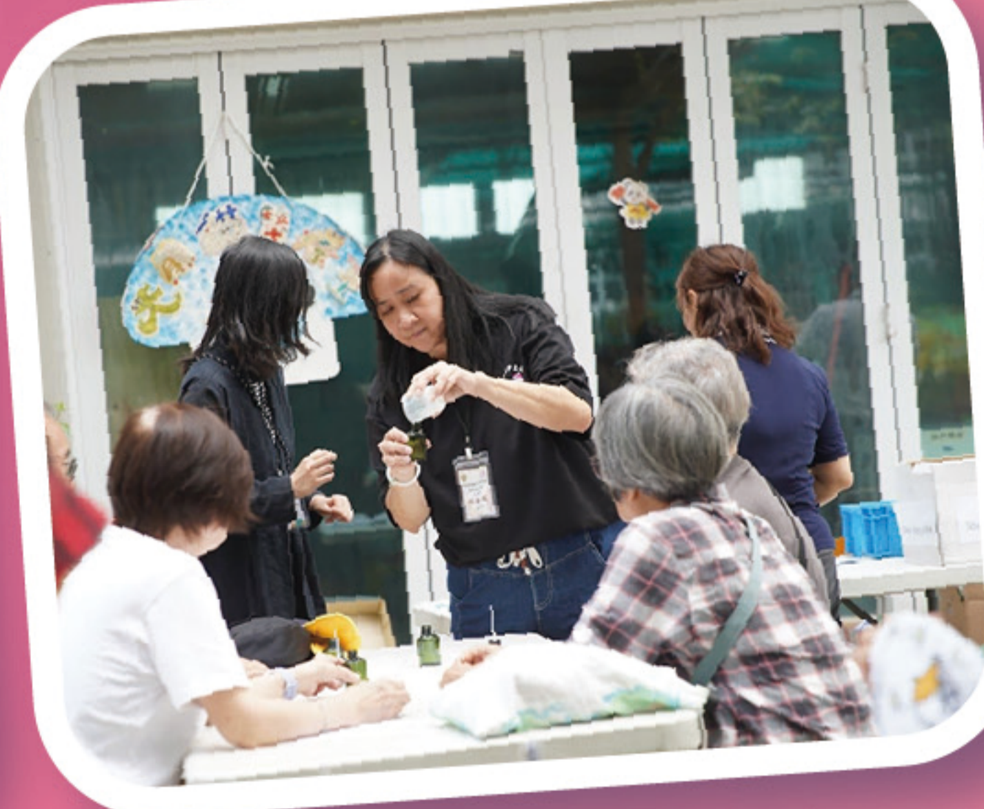
家長義工細心講解

與柏兩長者鄰舍中心合辦義工服務項目：「天然驅蚊水製作」。家長義工與長者一同製作驅蚊水及天然護膚膏，在溫馨的手作過程中傳遞關懷與歡樂，讓長者感受到社區的支持與溫暖。