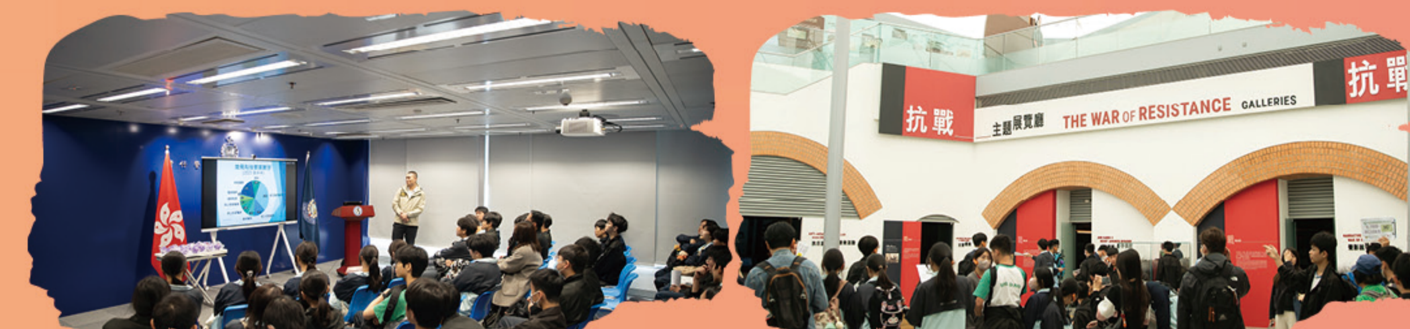
同學留心聆聽警察介紹