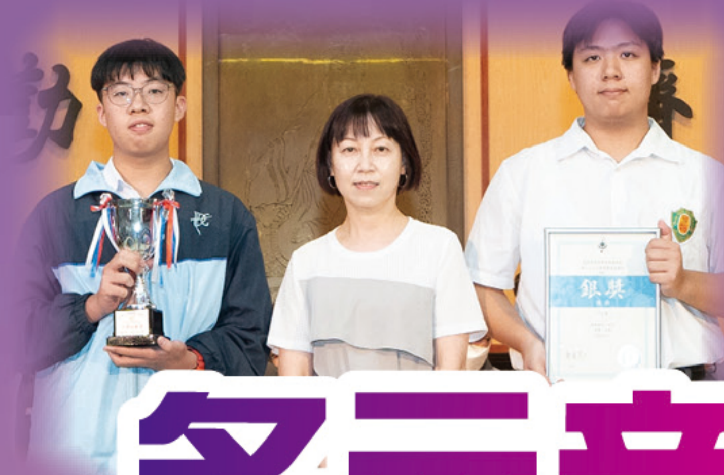
「愛祖國·傳承中華文化」歌唱比賽中學組 優異獎

整個學期的活動不僅豐富了家長與孩子的學習與生活體驗，更深化了家校合作，為學生的成長旅程注入更多支持與愛。