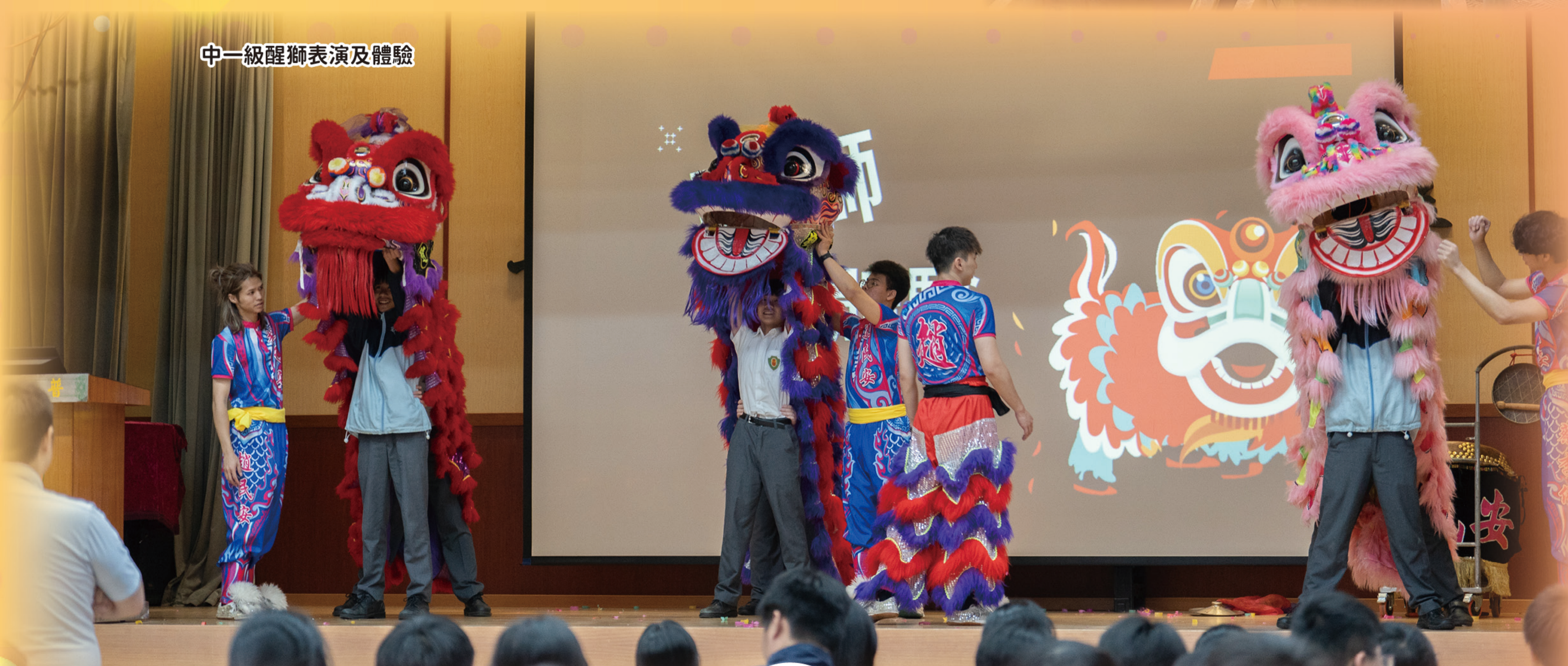
中一級醒獅表演及體驗