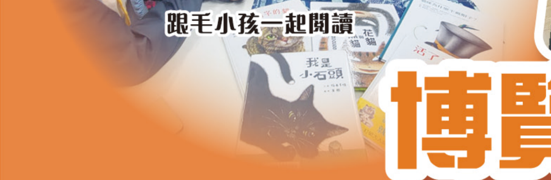
跟毛小孩一起閱讀