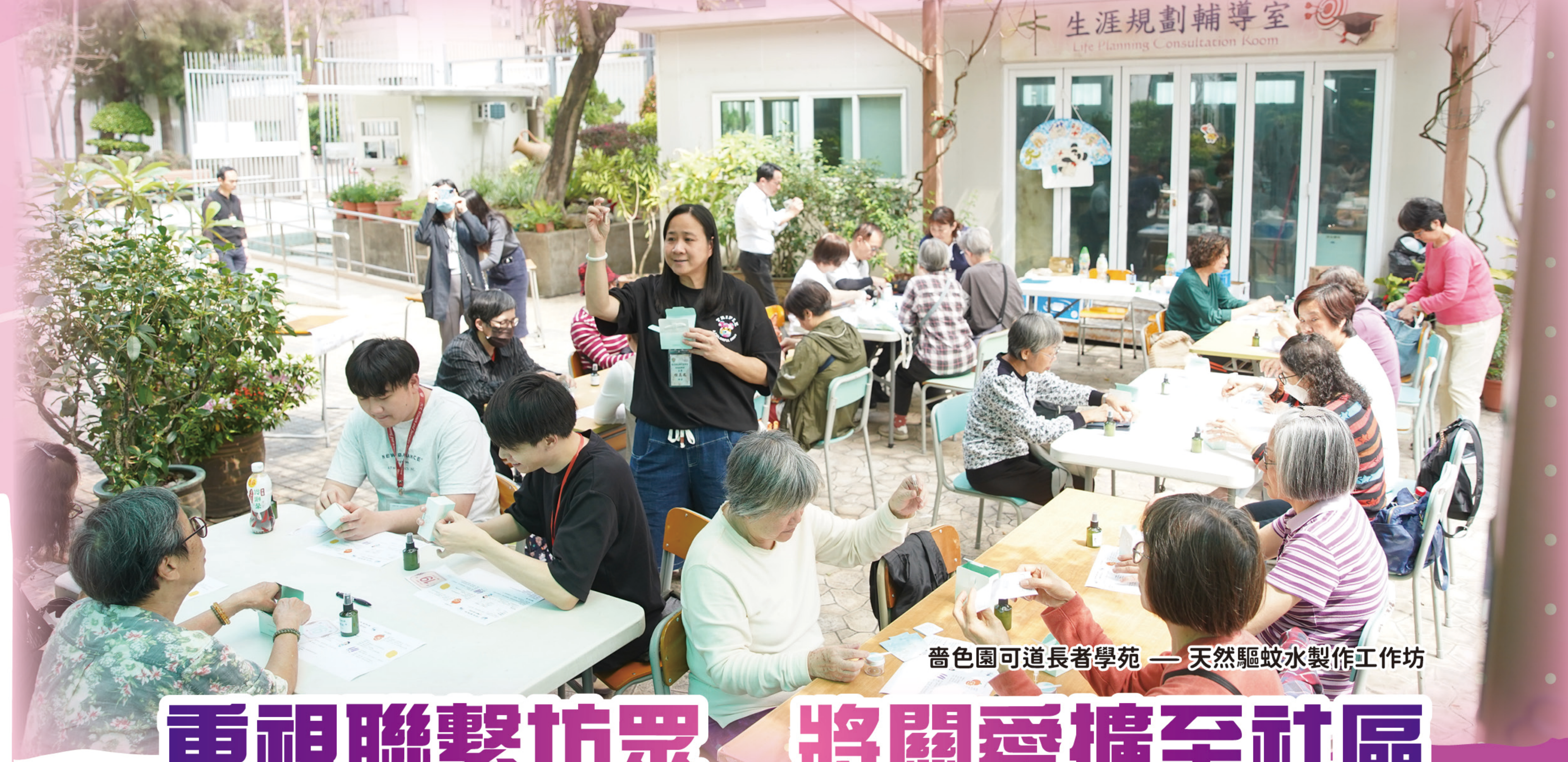
番色園可道長者學苑——天然驅蚊水製作工作坊