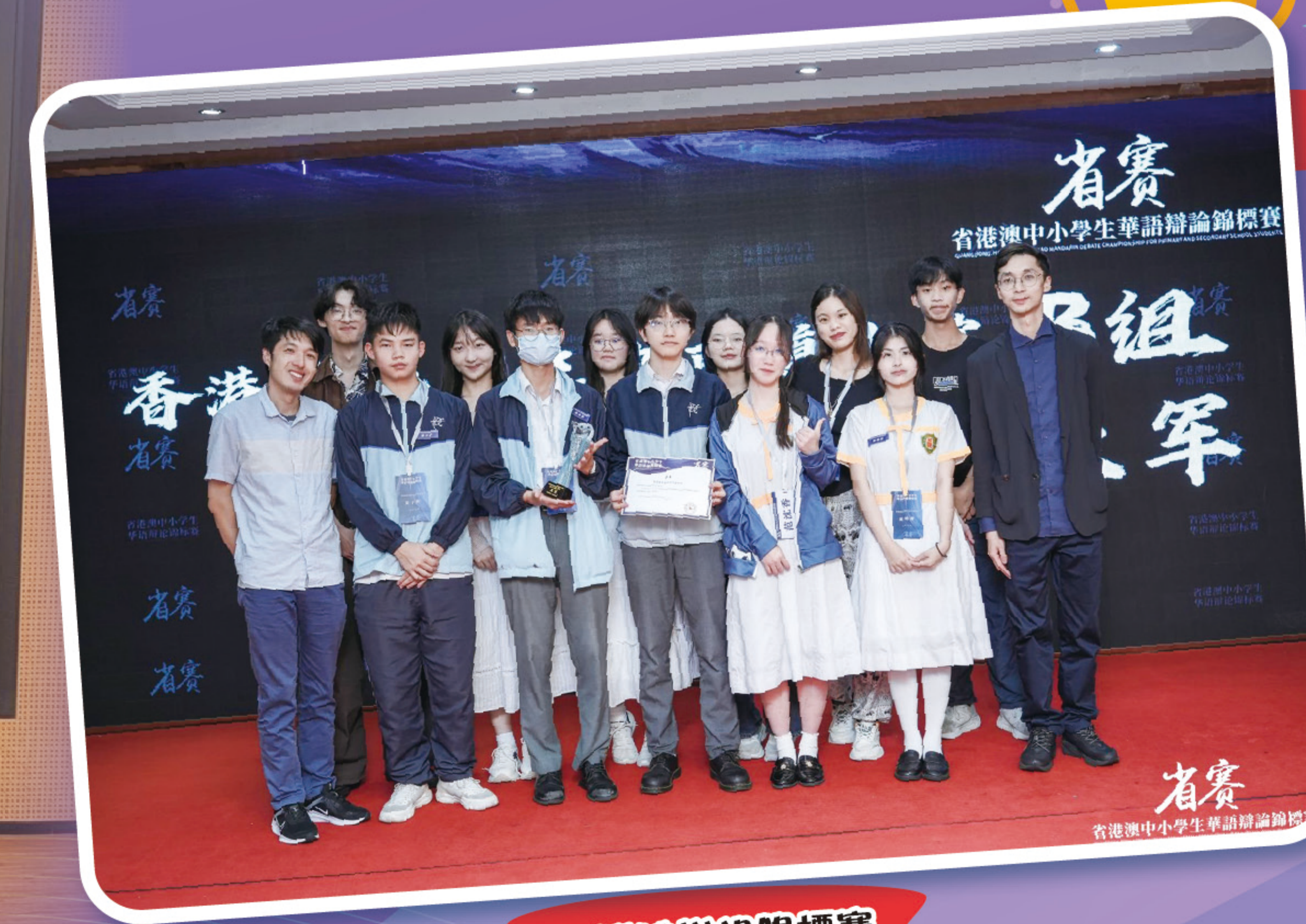
省港澳辯論錦標賽