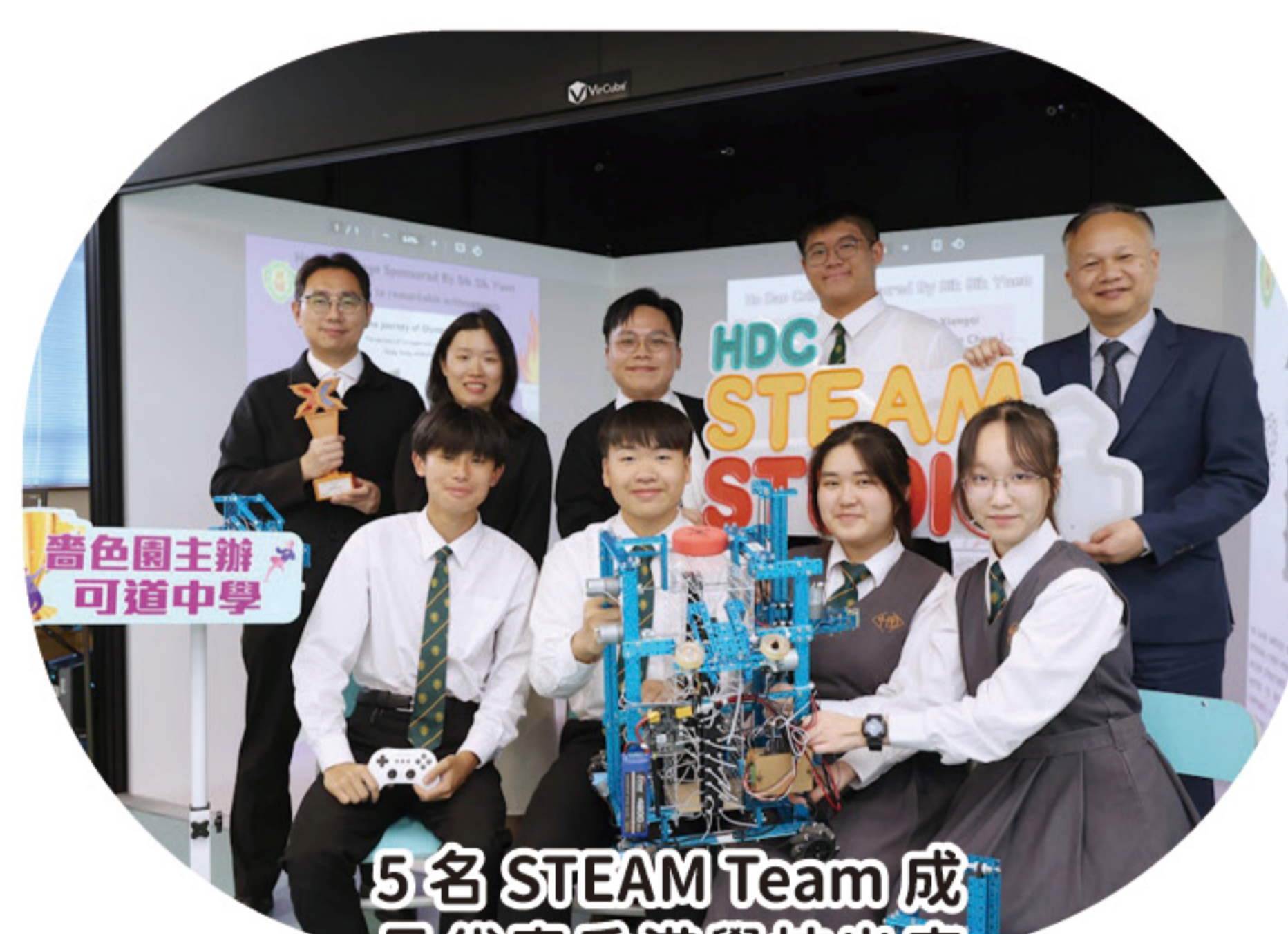
5名 STEAM Team 成員代表香港學校出席「英國教育科技博覽會」

本年度，本校更獲資訊科技教育領袖協會 (AITLE) 邀請，參加英國及丹麥教育科技交流團，並代表中國香港在英國教育技術及設備展覽會 (BETT UK 2025) 上，向全球展示學生的優秀創科作品，當中包括「VR 中華文化博物館」、「虛擬文物遊」、「AR 觸得到的奧運」及「MakeX 機械人」。透過是次交流，同學不僅有機會觀摩來自不同國家學生的創新作品，拓闊了國際視野，更在個人自信、外語溝通能力及創意思維方面均得到顯著提升。回港後，同學們的優異表現亦獲得肯定，獲邀接受香港電台訪問，暢談是次寶貴經歷與感受，成為學弟學妹們學習的典範。