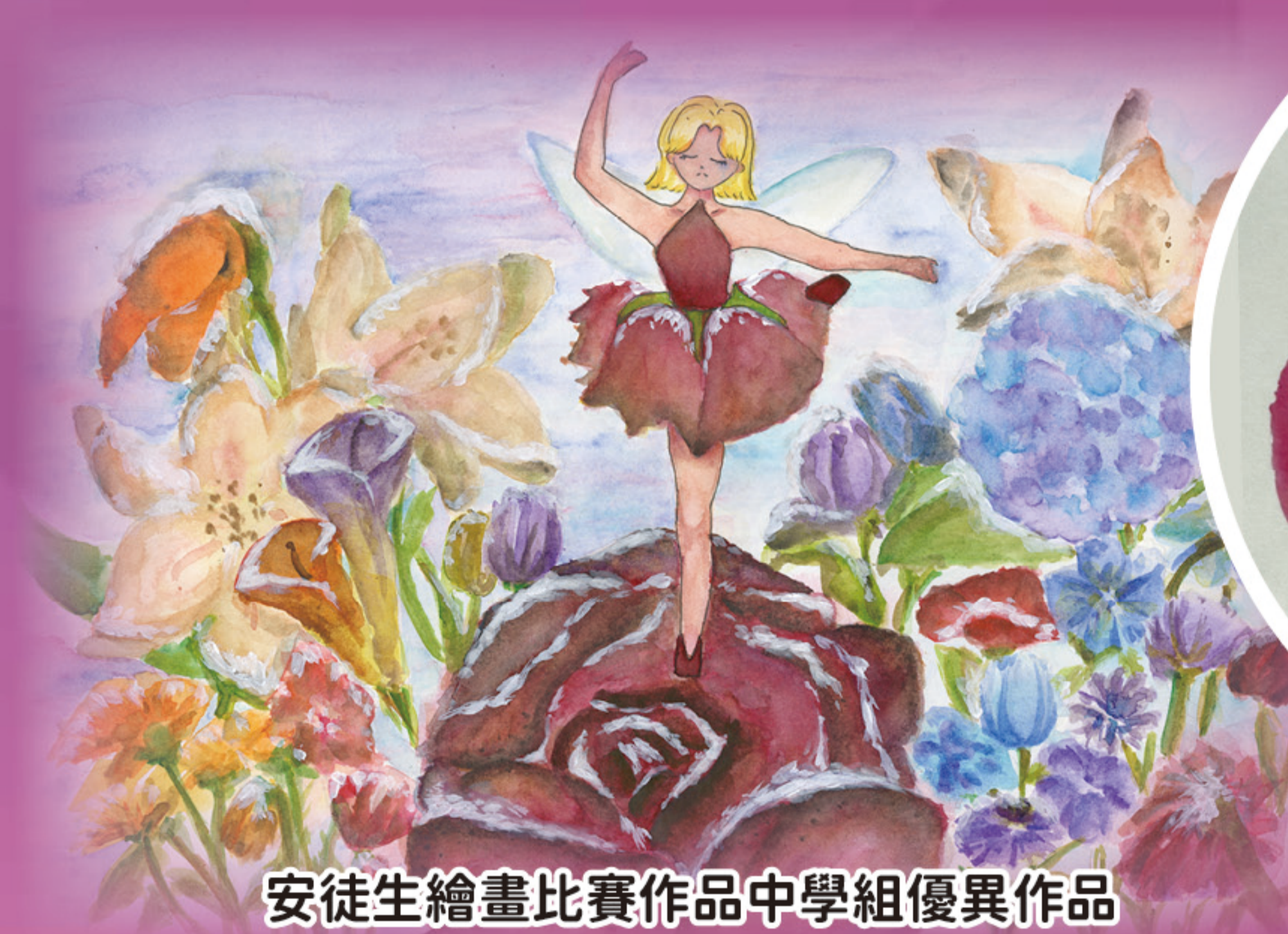
安徒生繪畫比賽作品中學組優異作品

視覺藝術科主要培育學生的美育素養。適逢今年是本校三十五周年慶典，經校方及同學遴選，最後選出最受老師歡迎、最受學生歡迎及專業評審三項大獎。最終得獎作品最能表達本校主辦團體的三教、關愛文化及接軌世界等元素。為發掘有潛質的學生，本年度重點參與藝術創作比賽，當中有全港性的創作比賽，如全港青年學藝比賽及安徒生繪畫比賽，學生透過參加比賽，增強藝術觸覺及評鑑能力。