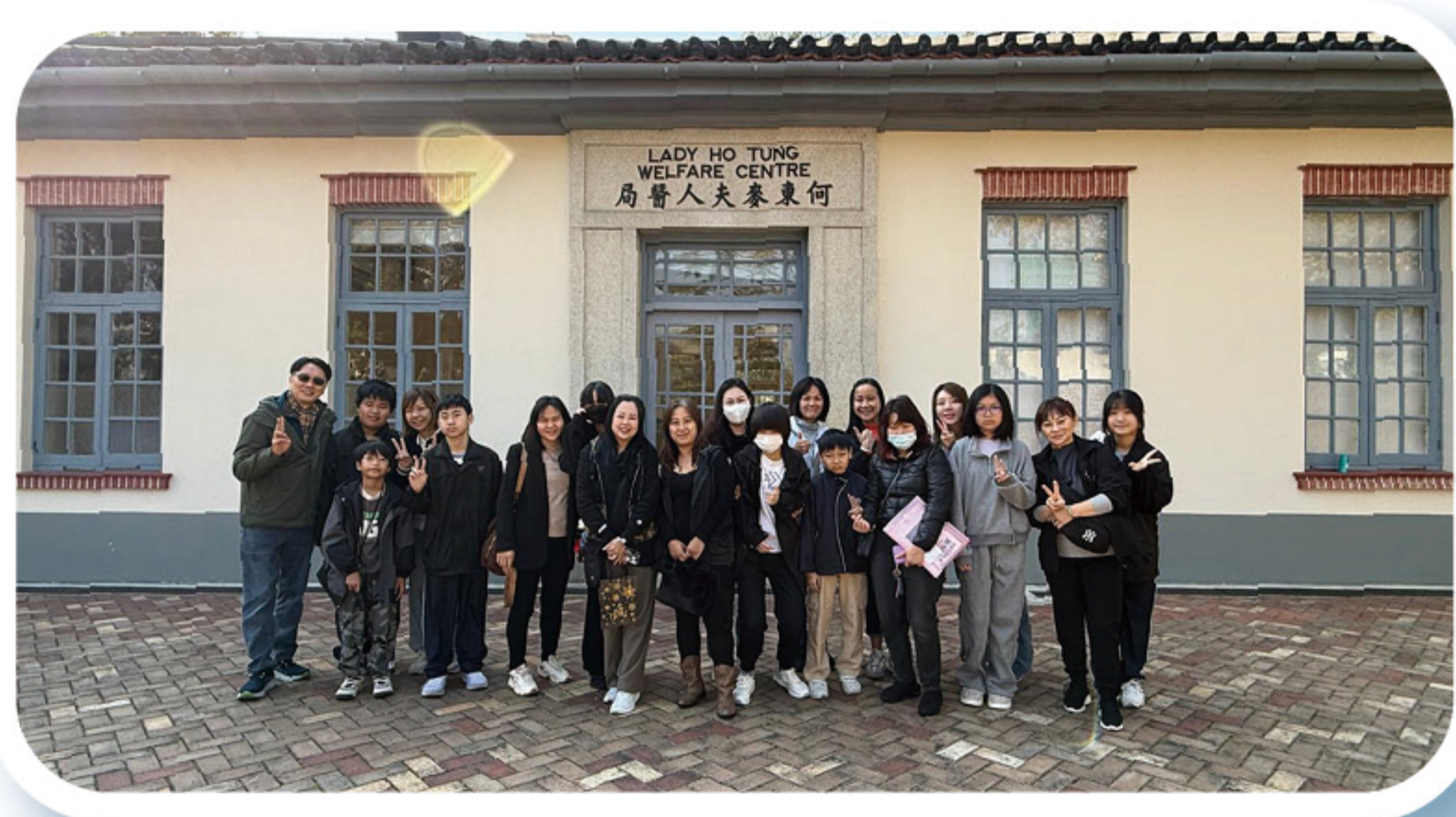
參觀何東夫人醫局·生態研習中心

本年的「洪福邨嘉年華」以中華文化傳承為主題，家長教師會設有香囊製作攤位，讓家長與子女一同體驗中國傳統民間工藝，並與社區居民共享歡樂時光。在「可道資訊日」，家教會家長委員擔任義工，熱情接待到校參觀的小學家長，並耐心介紹家教會的工作與理念，讓訪客留下深刻印象。