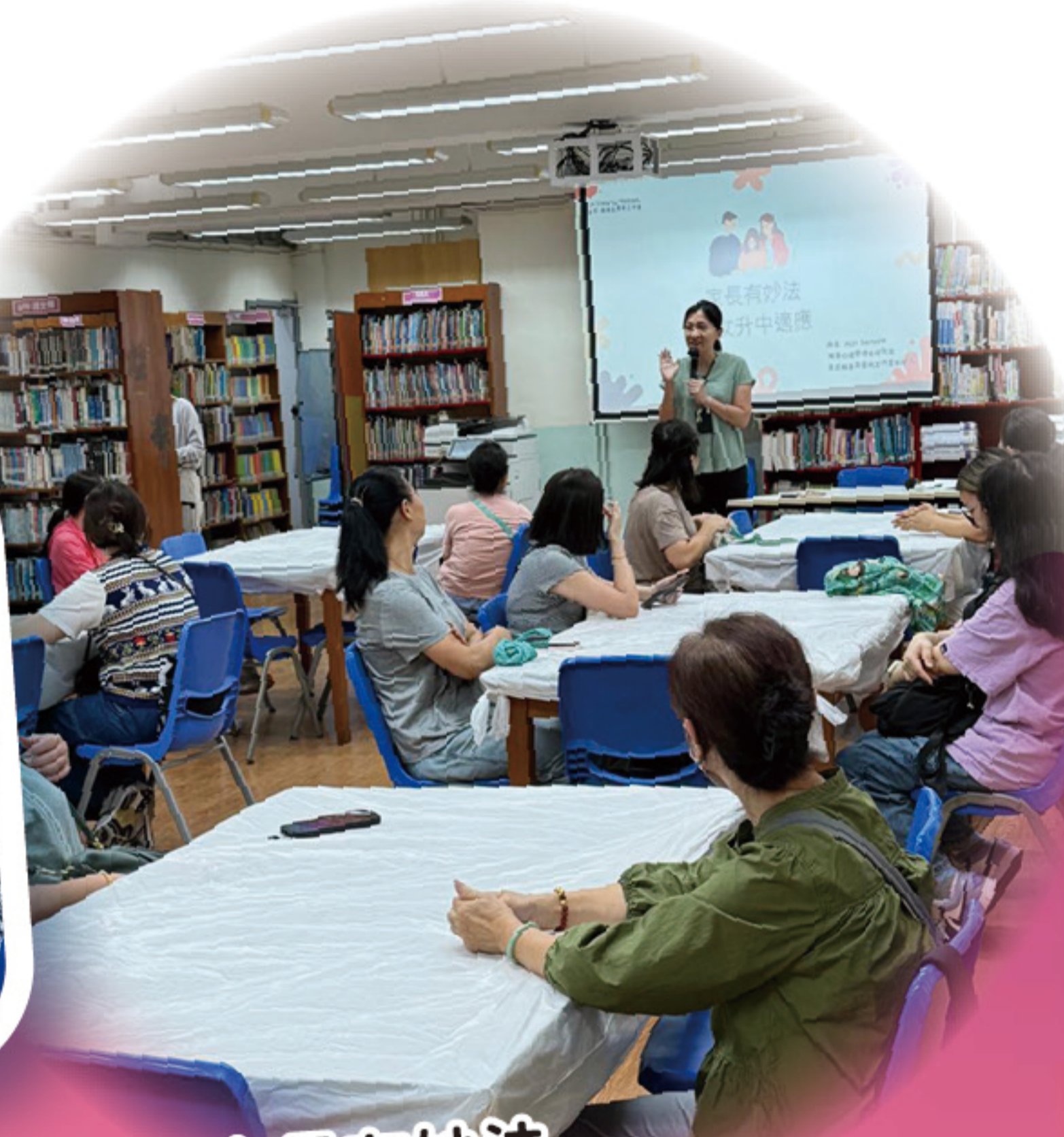
家長有妙法——子女升中適應

此外，家教會亦安排了一系列家長講座，主題涵蓋「正向管教」、「中華文明在世界的發展」、「性格透視®工作坊」及「子女升中適應」等，為家長提供學習與交流的平台，協助他們更深入地了解子女的成長需要與教育方向。