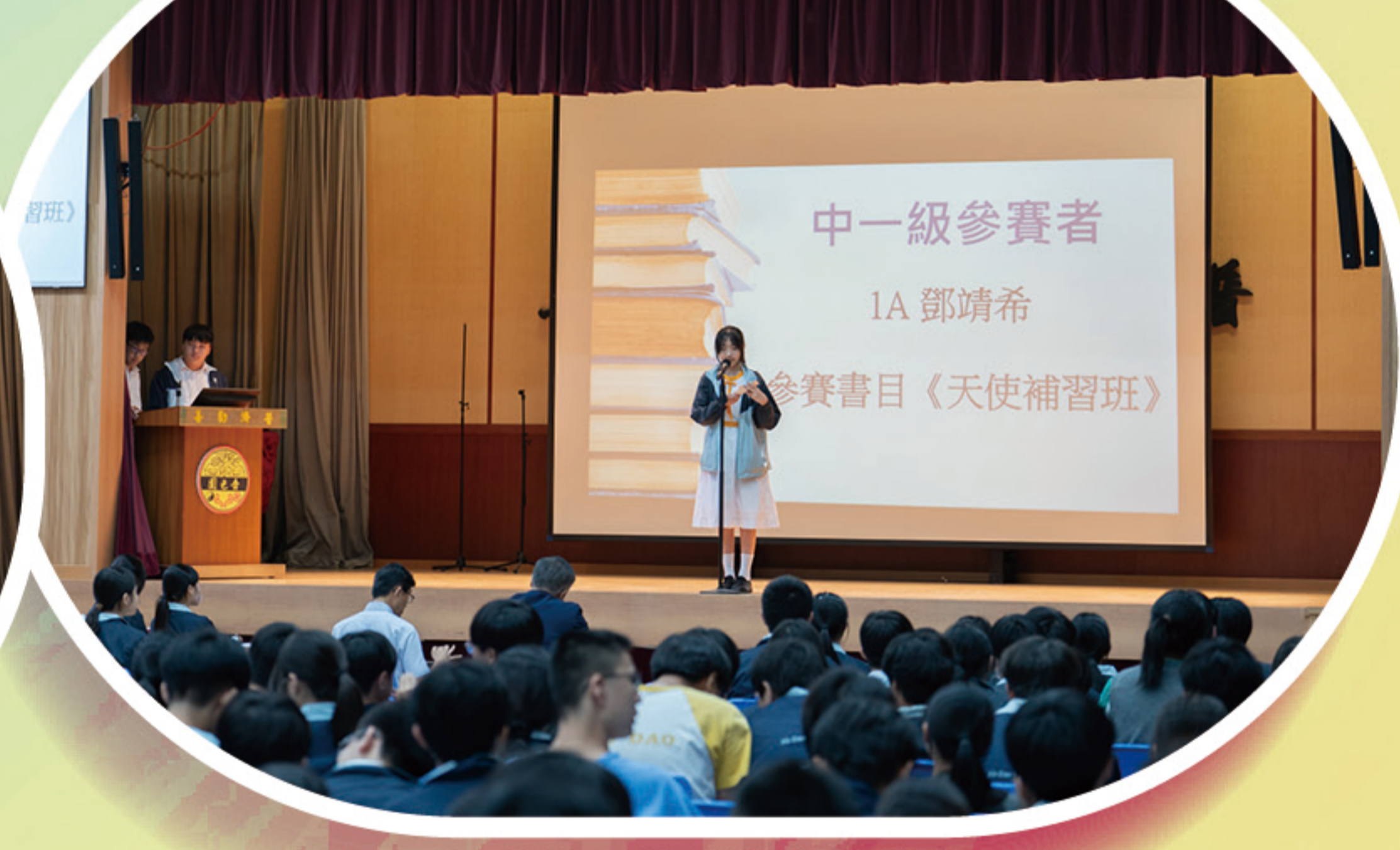
閱讀匯報比賽現場