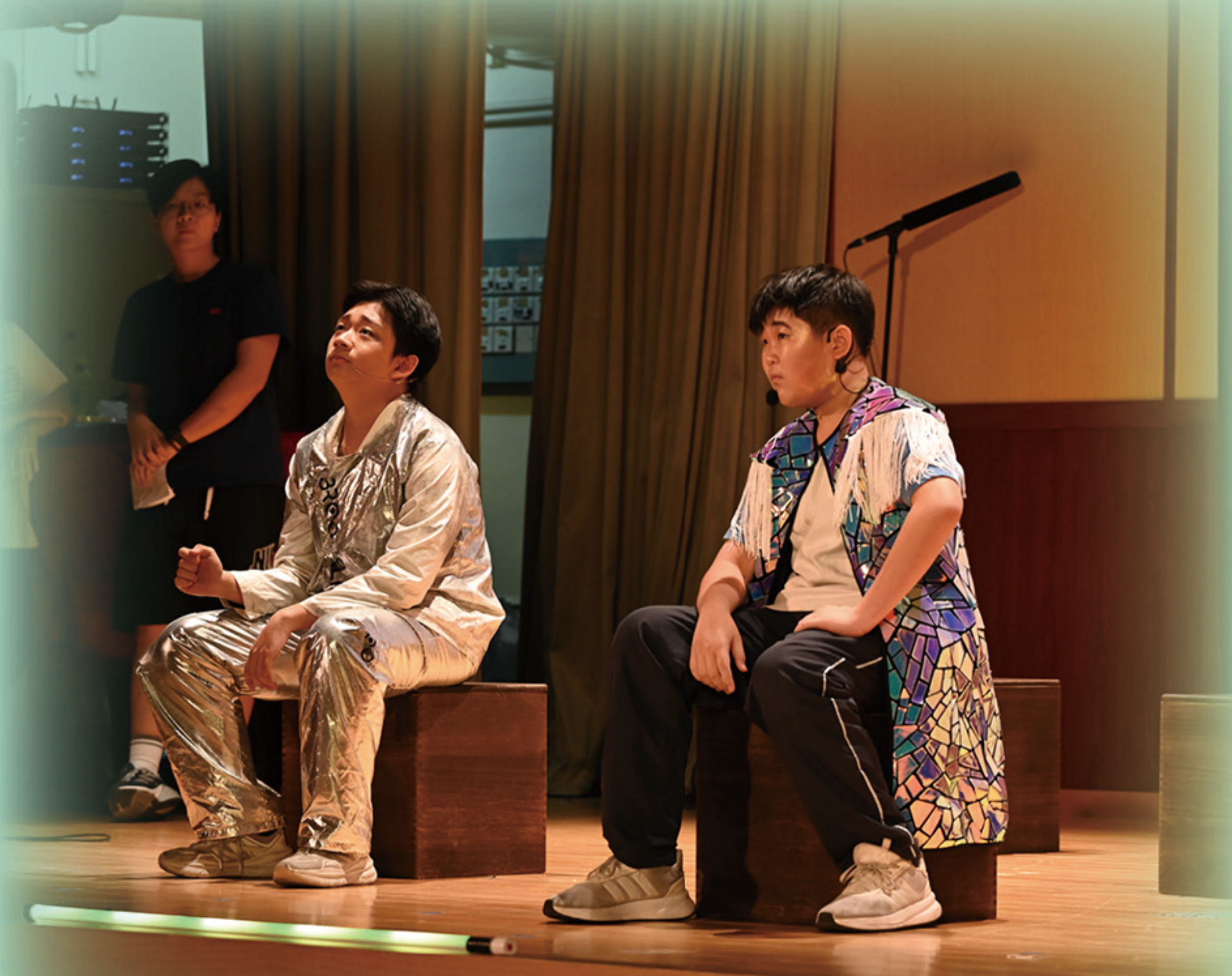
戲劇帶來短劇《穿越時空的「禮」》