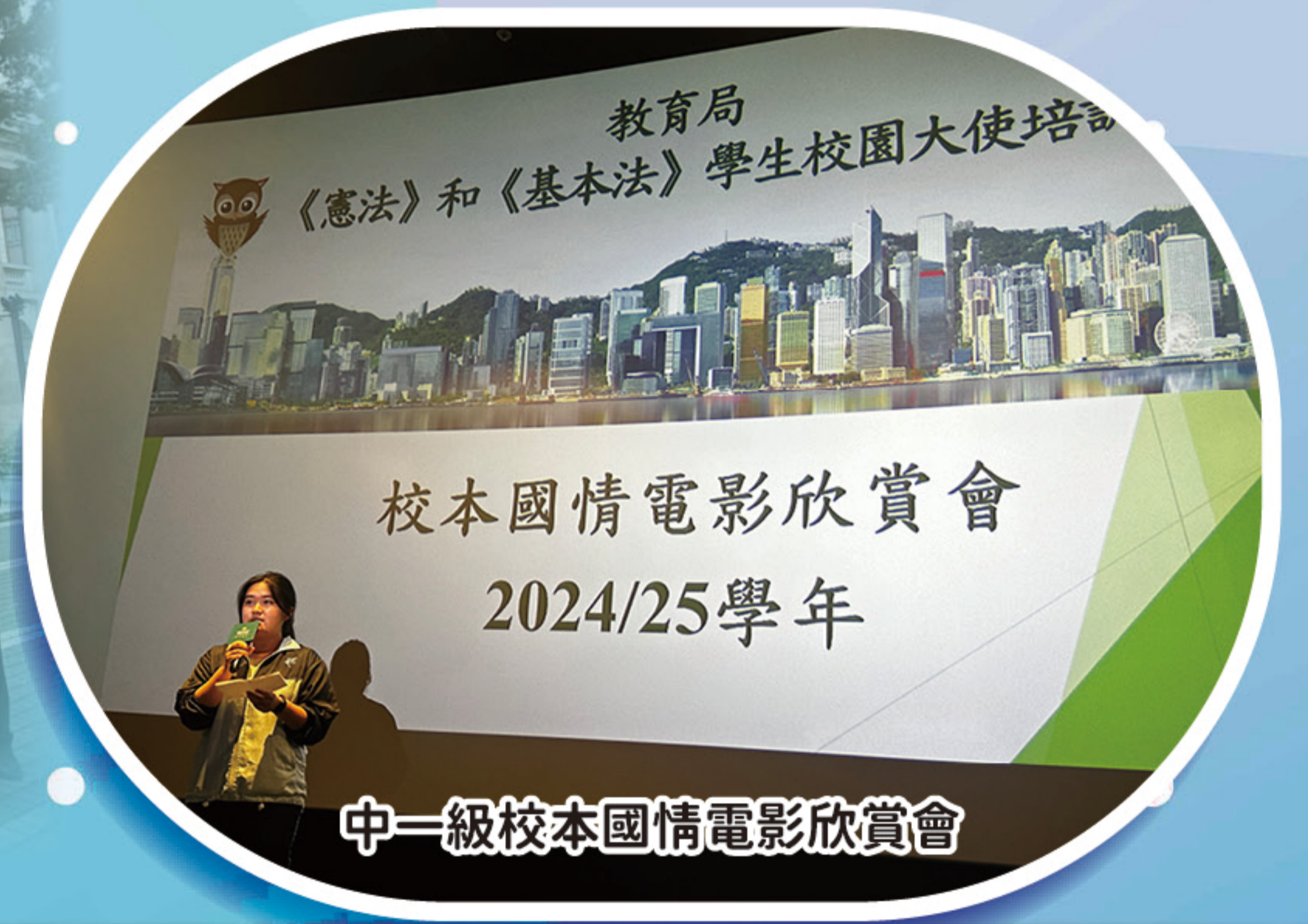
中一級校本國情電影欣賞會