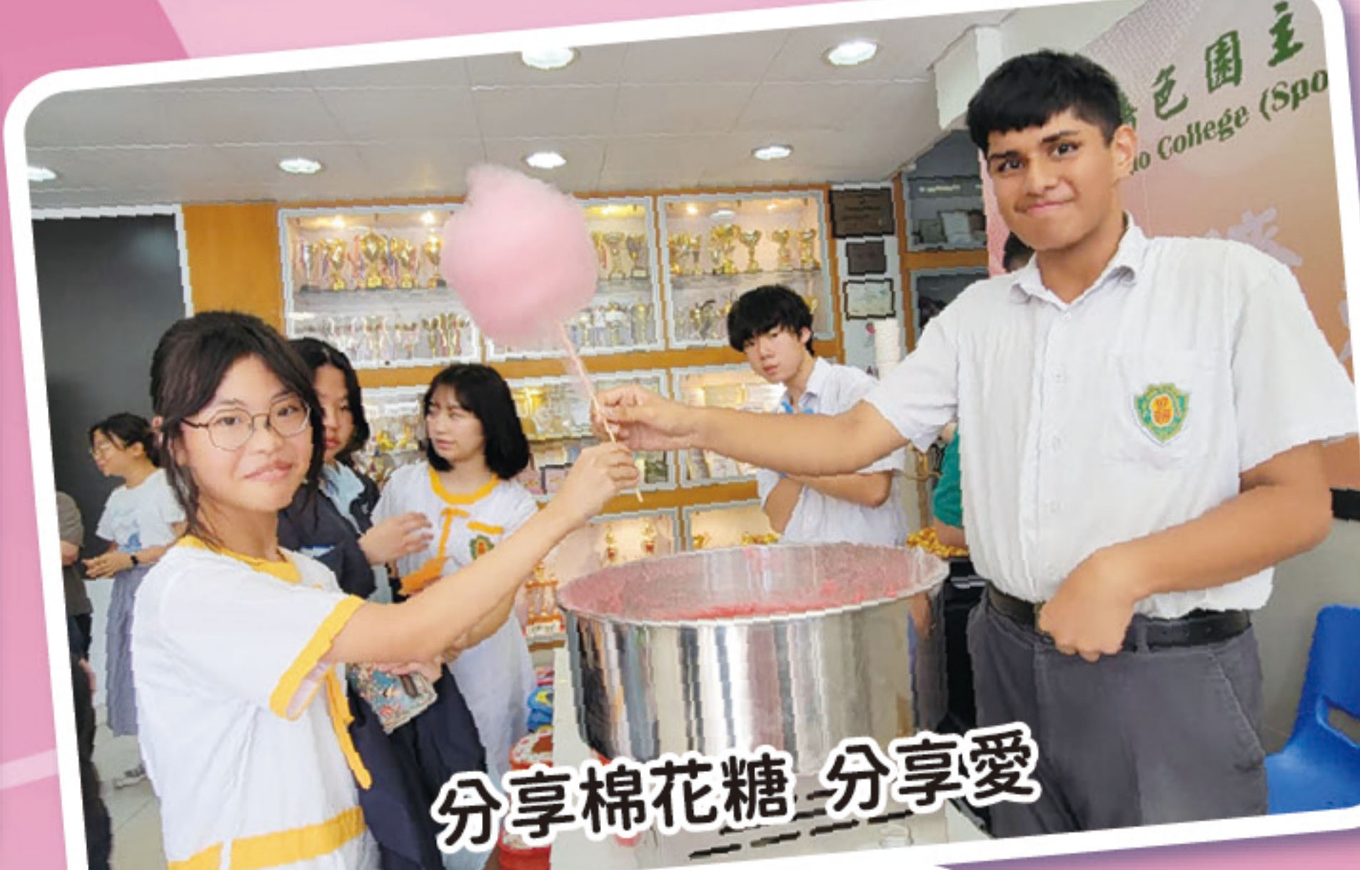
分享棉花糖_分享愛