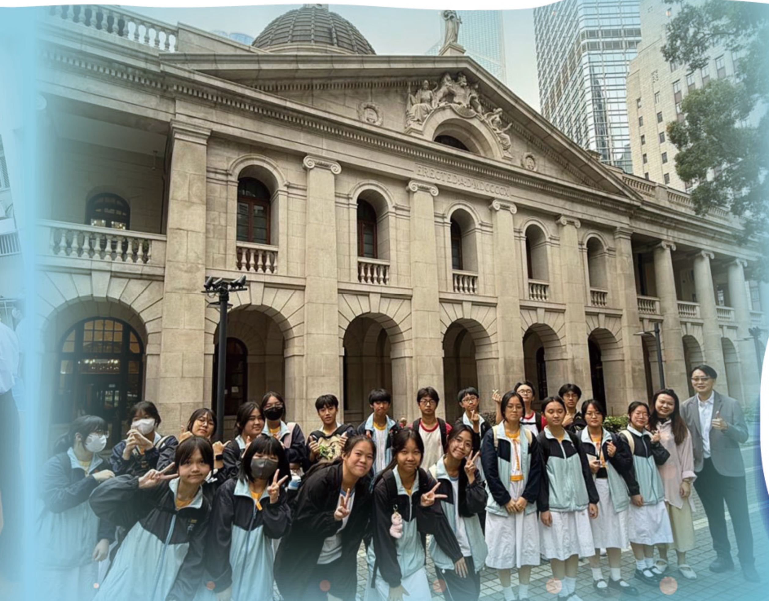
參觀香港終審法院