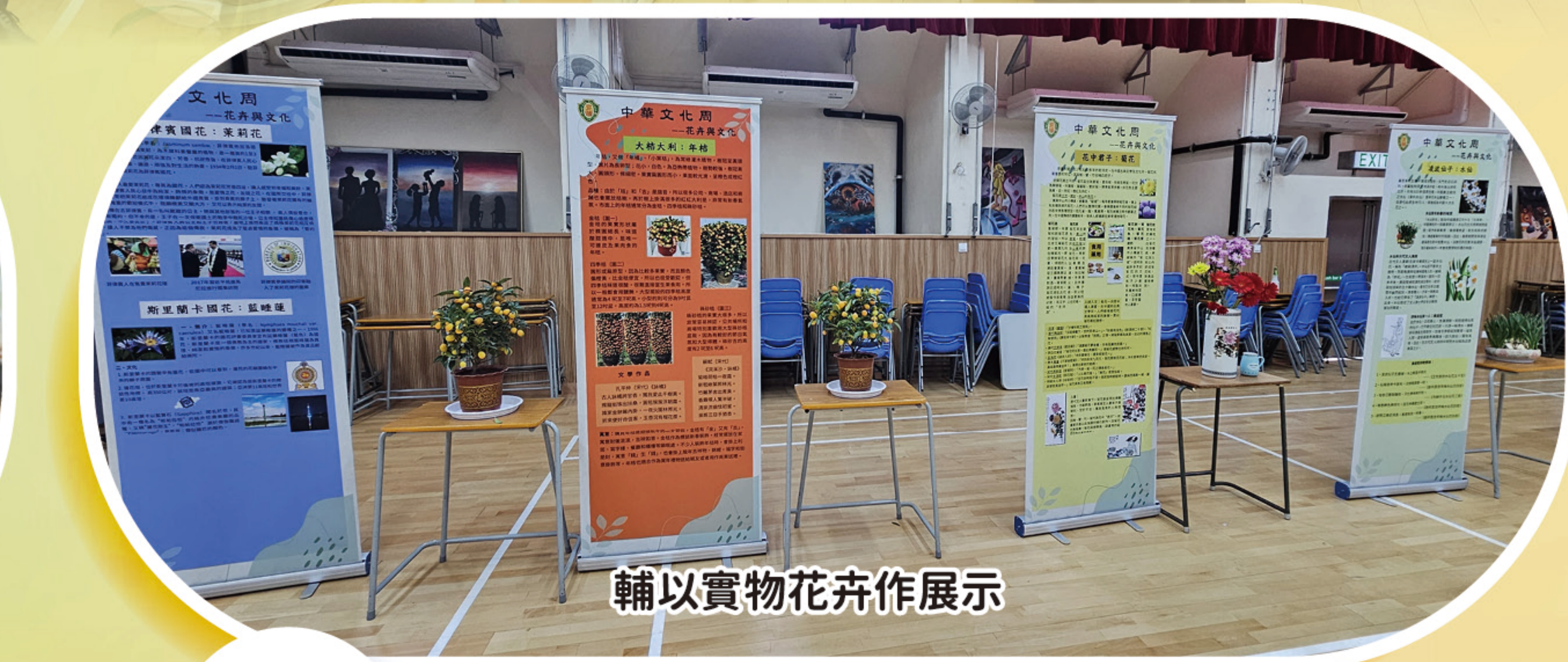
輔以實物花卉作展示