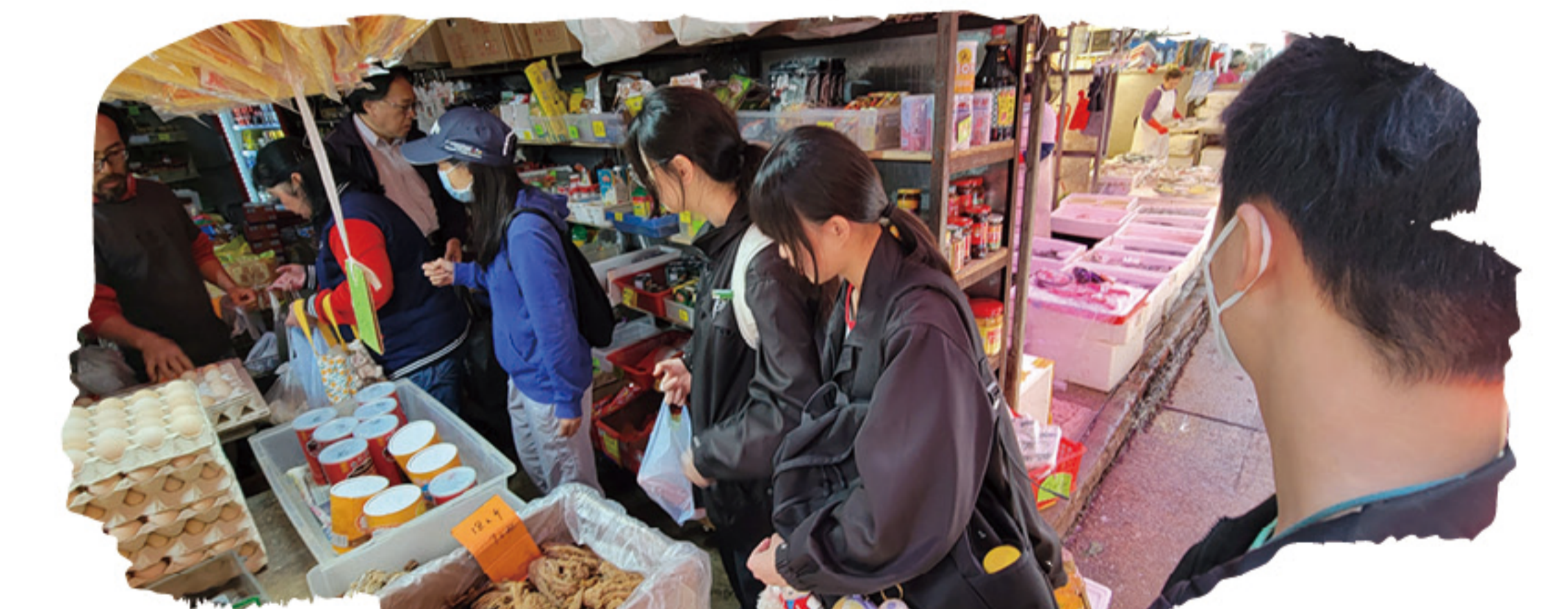
學生進行社區探訪