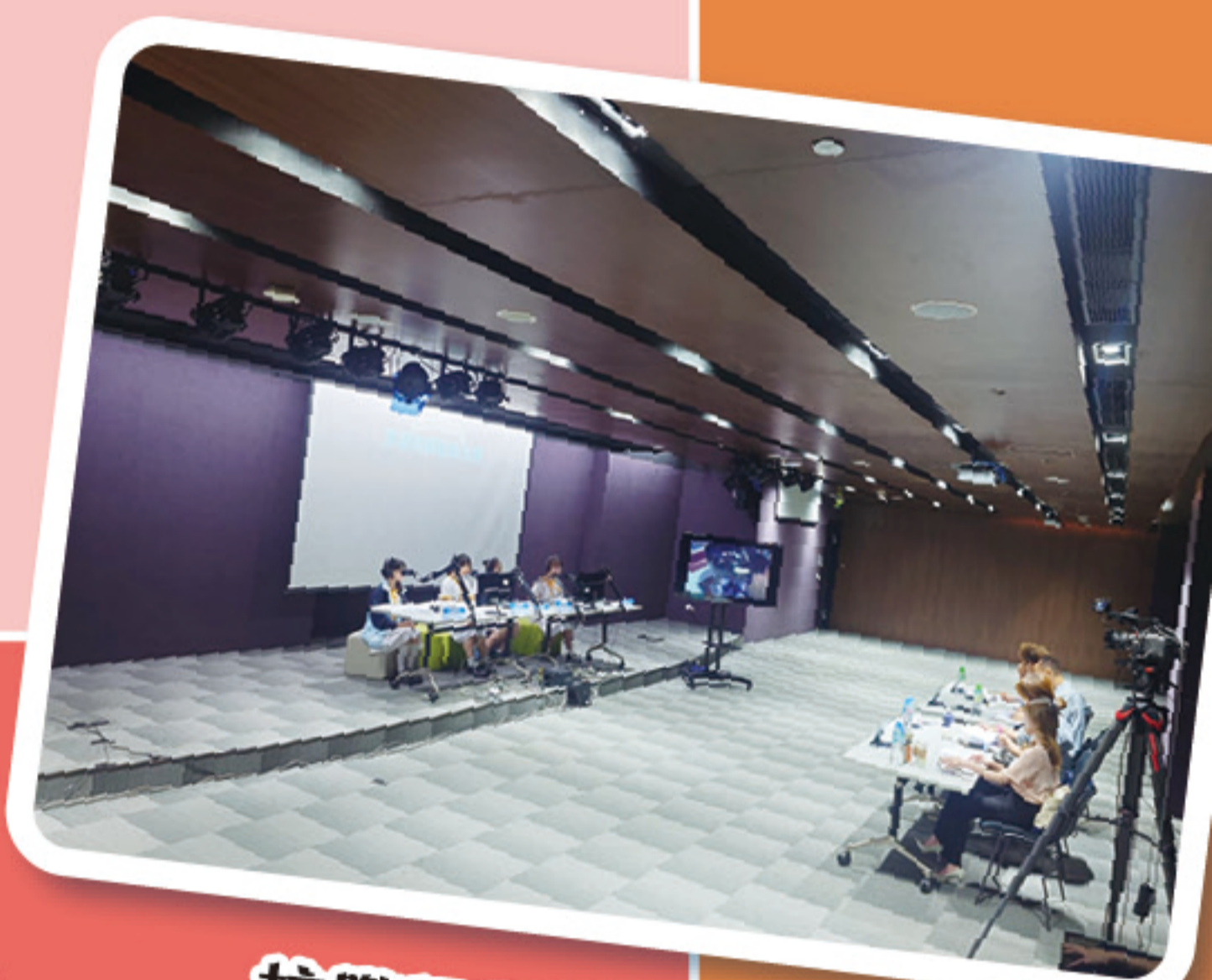
校際田徑賽三位獲獎男生同學參加配音比賽