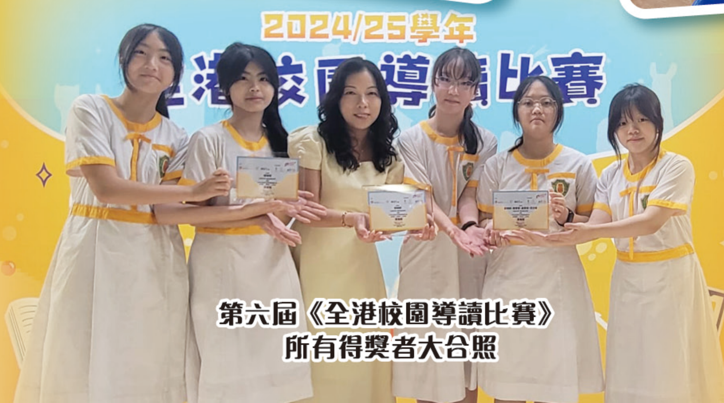
第六屆《全港校園導讀比賽》所有得獎者大合照