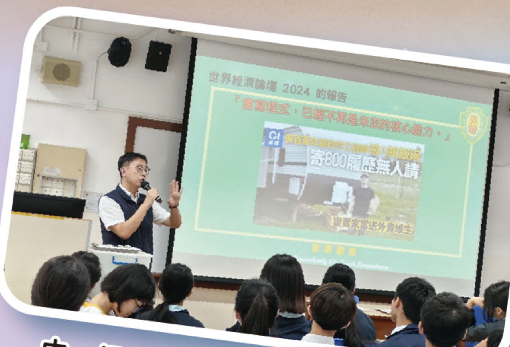
中一級 STEM 體驗日主旨演講