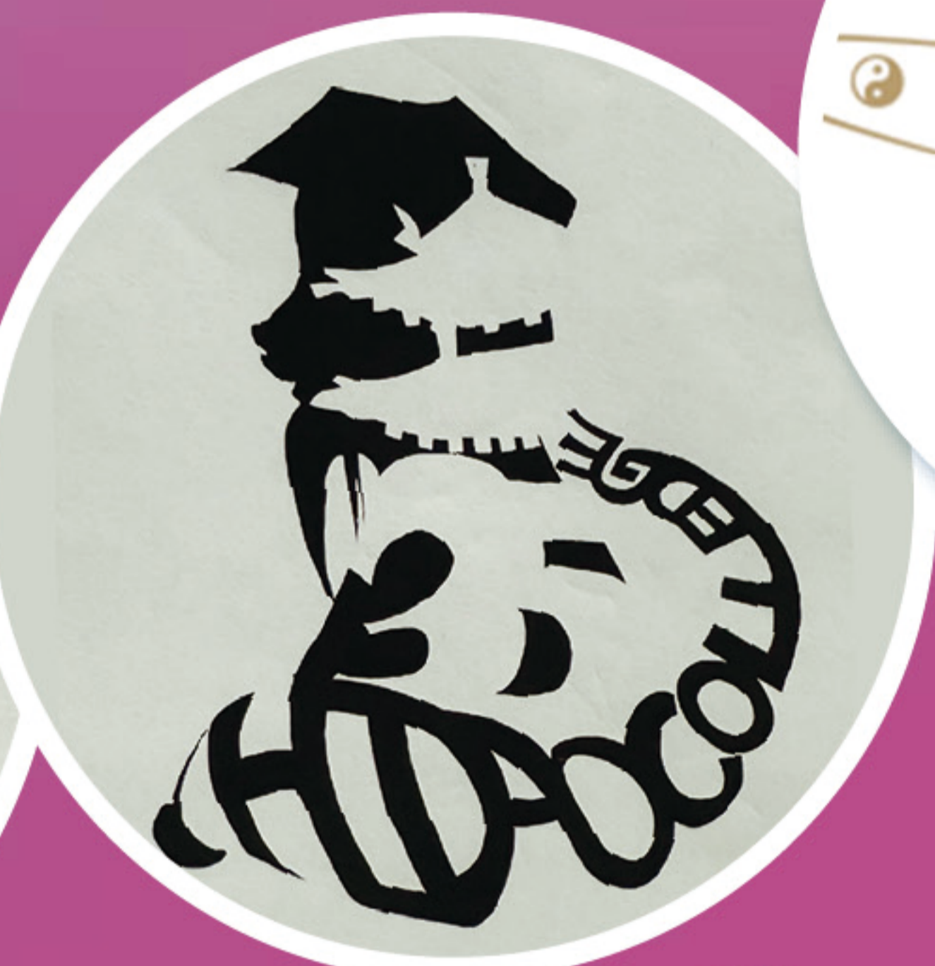
35周年校慶標誌 最受老師歡迎獎