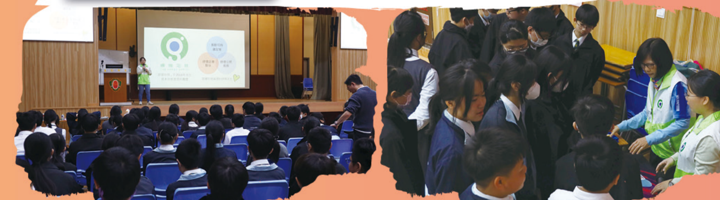
同學投入參與講座