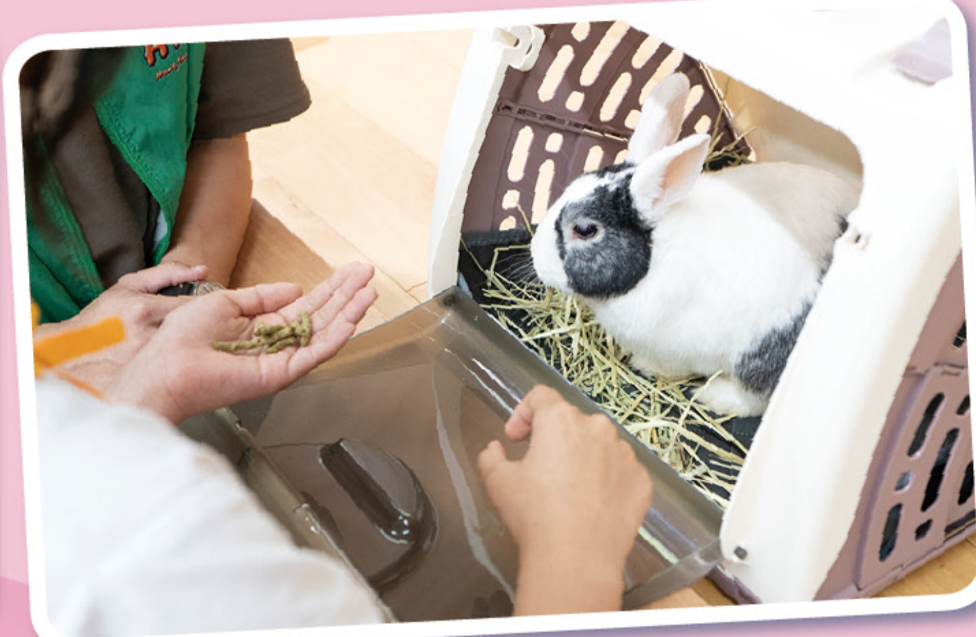
愛心滿滿的同學餵飼小兔