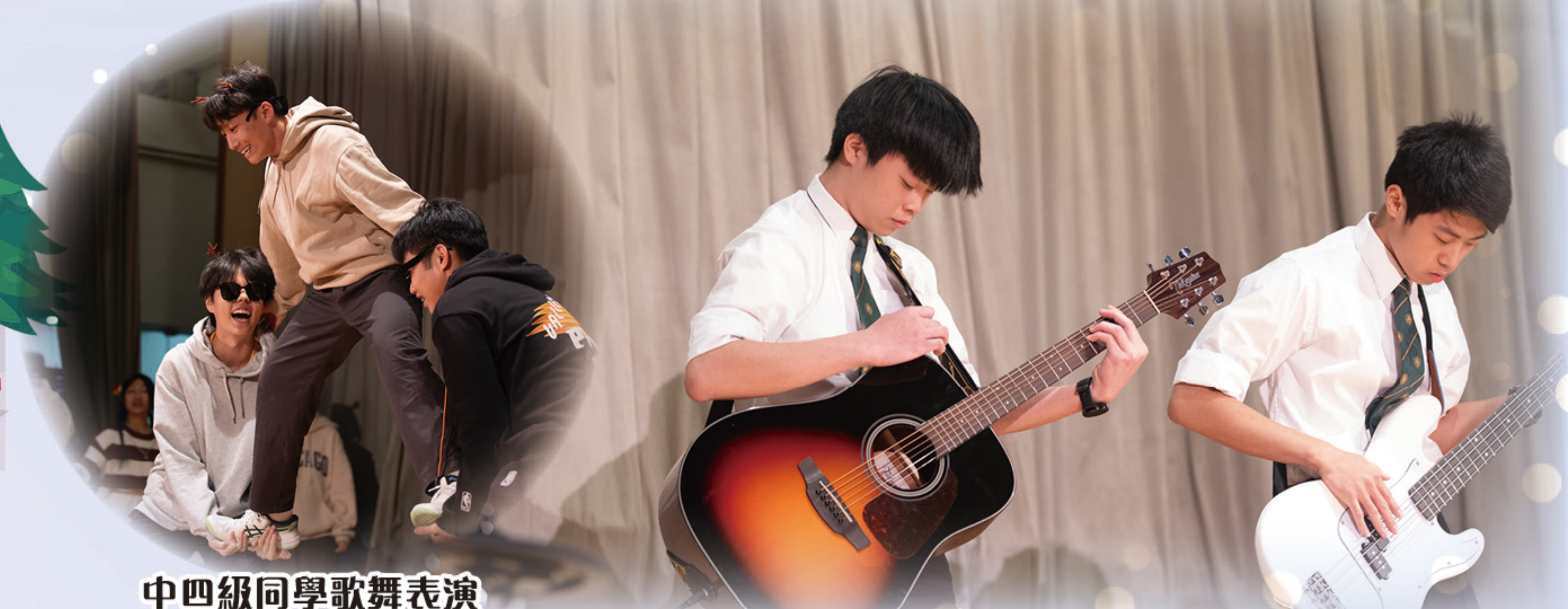
中四級同學歌舞表演

為配合班級經營及提升對學校的歸屬感，學生會及聯課活動組合辦聖誕聯歡日，活動包括班際歌唱比賽及課室聯歡，各班同學悉心打扮、載歌載舞，氣氛熱烈、和諧歡樂。