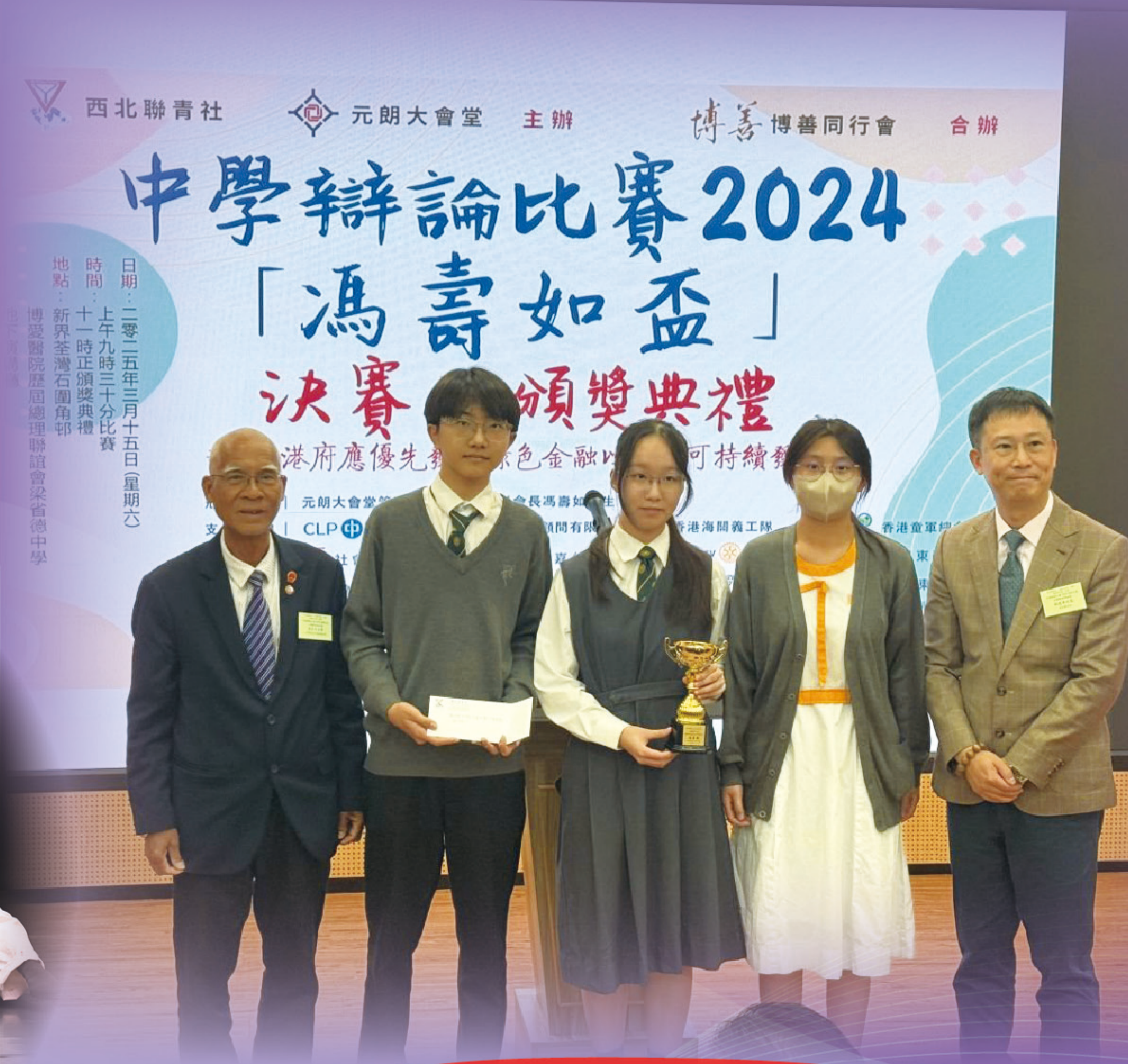
馮壽如盃辯論比賽頒獎典禮