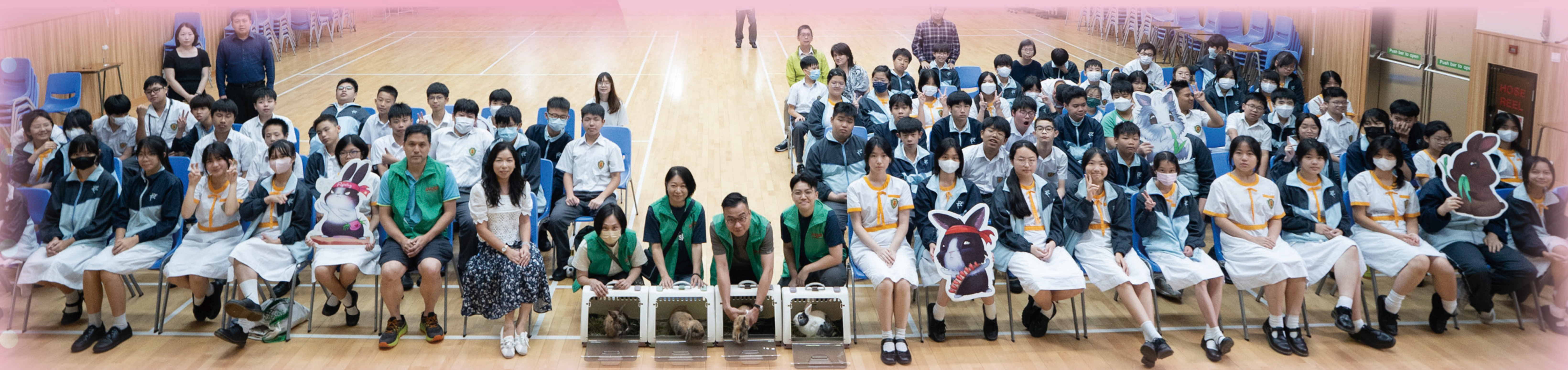
謝謝四位兔仔老師