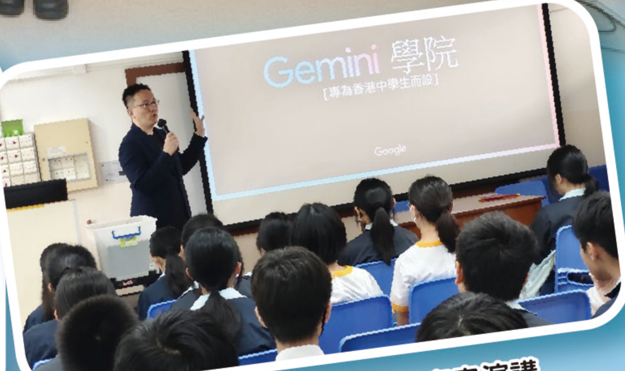
中一級 STEM 體驗日嘉賓演講