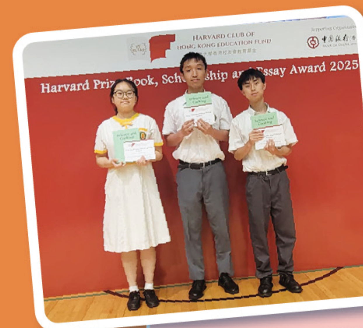
「哈佛圖書獎」的得獎同學

為推廣閱讀風氣，培養學生自學習慣，本校圖書館籌辦各類型閱讀活動，其中包括「毛讀友偶」，該活動結合毛小孩、閱讀及藝術創作的洗滌心靈活動。由毛小孩充當老師，跟同學一起閱讀，分享小動物的故事。也跟同學一起做小手工，享受每個放鬆時刻。圖書館亦於萬勝節、聖誕節及春節，與英文科、生活與社會科、公民與社會發展科合作，進行了共三次的「LIBRARY CAFÉ」，讓同學可以「從閱讀中喜歡學習，從學習中喜歡閱讀」。此外，亦舉辦配音培訓，由資深配音員為同學進行有系統及專業的訓練，讓同學對閱讀及聲演有更深層次的理解，並學以致用參加聲演及配音比賽。