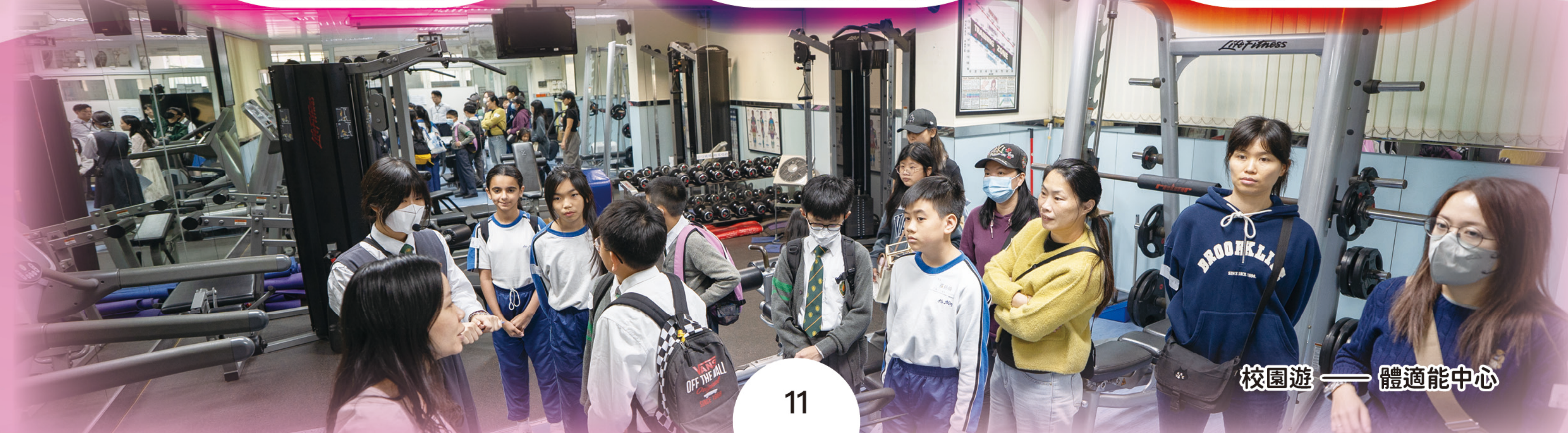
校園遊——體適能中心