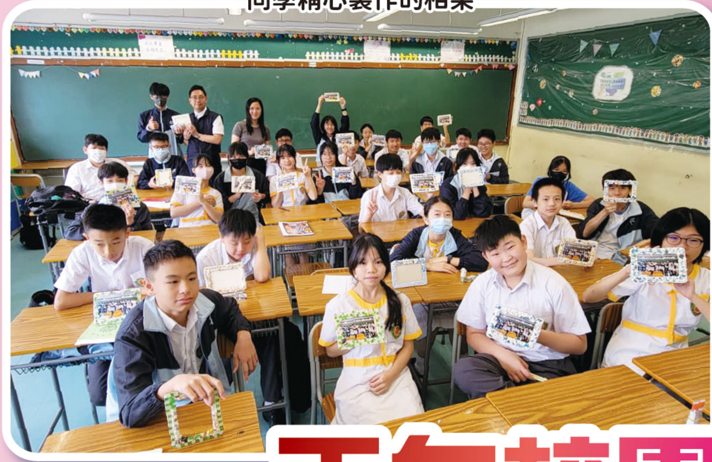
同學精心製作的相架