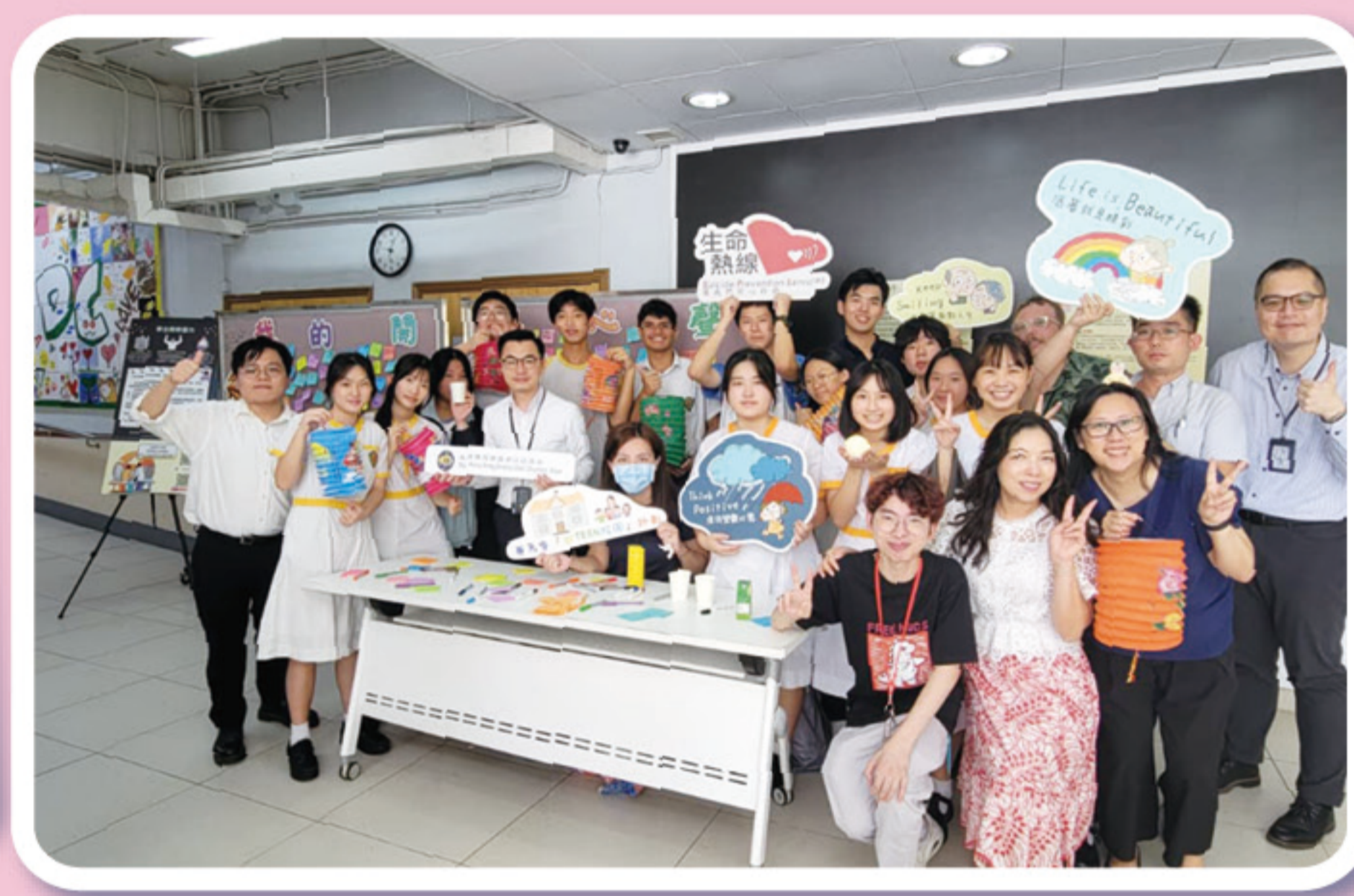
樂 TEEN 大使為同學送上佳節小食