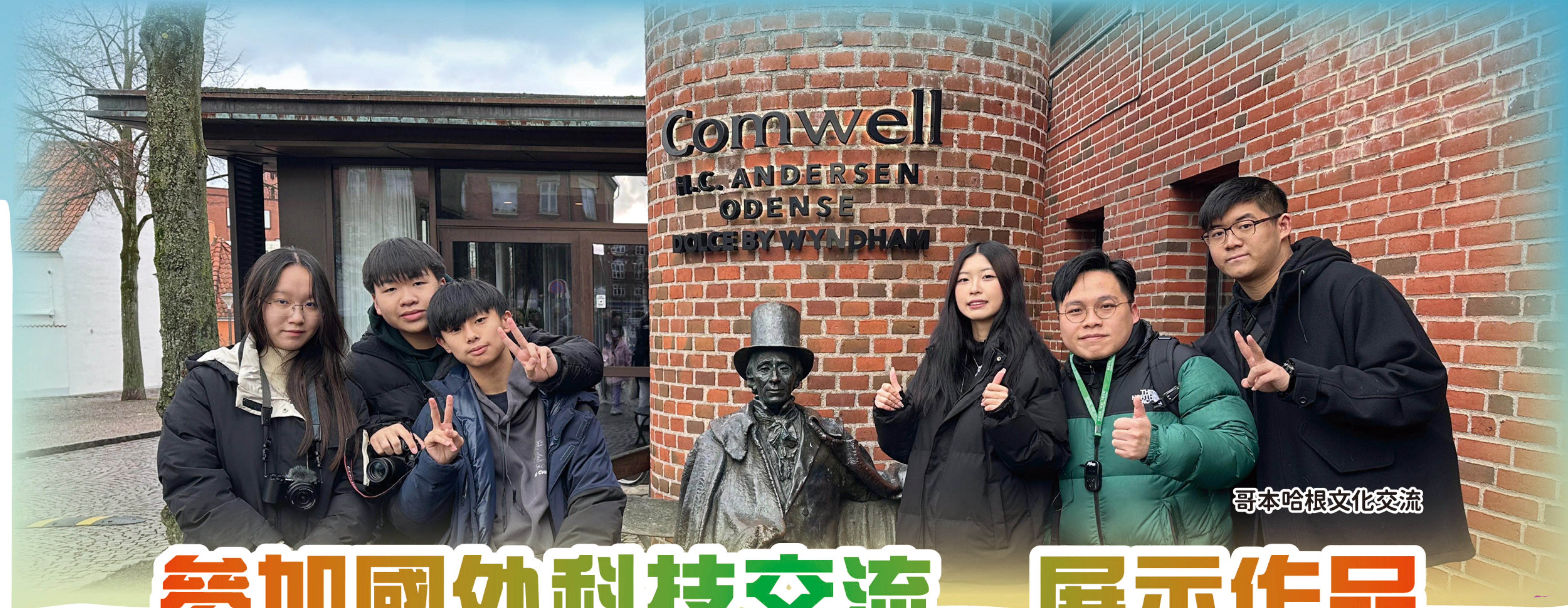
哥本哈根文化交流