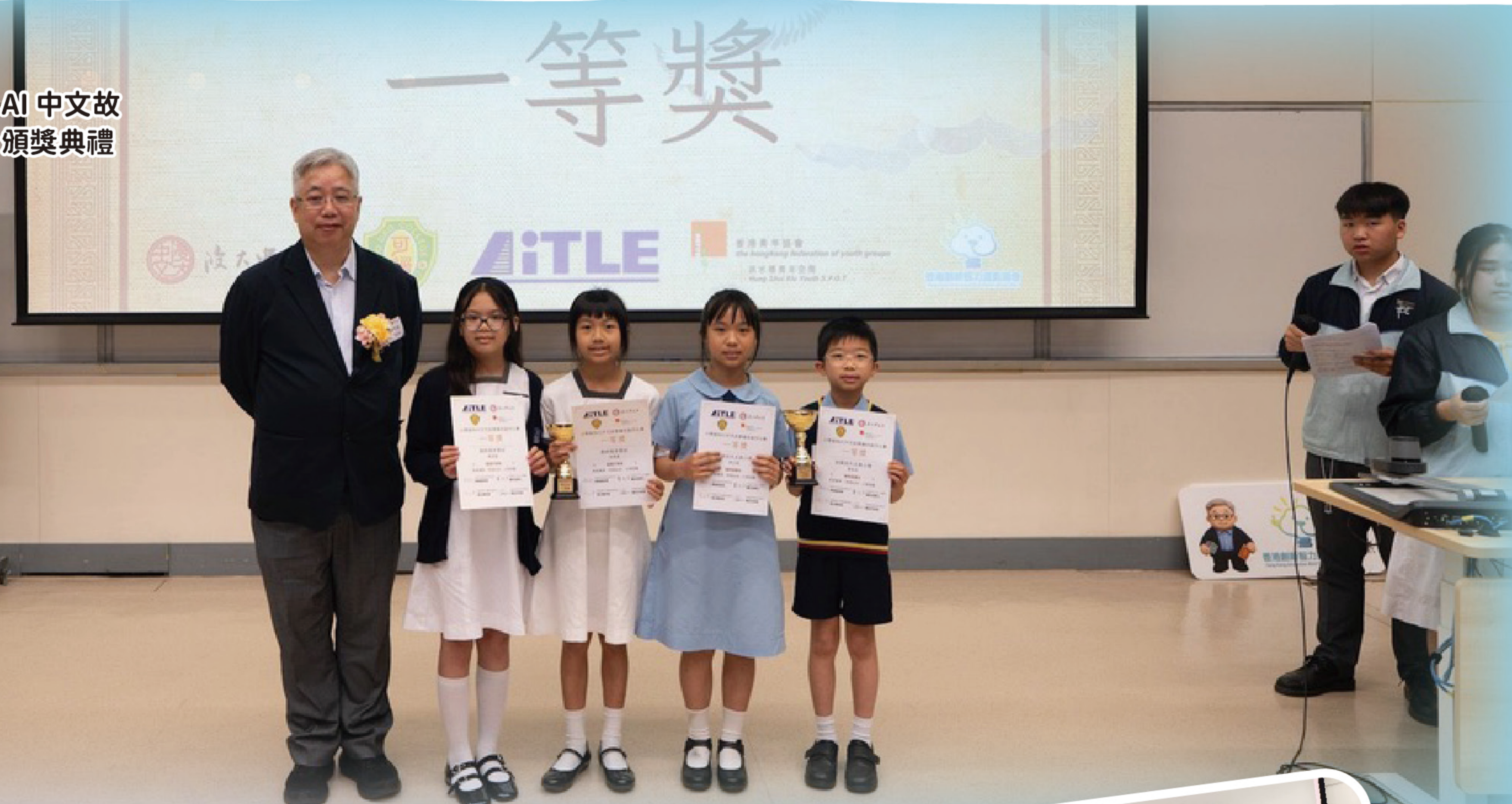
第一屆小學創科 AI 中文故事繪本創作比賽 頒獎典禮

本校致力推動多元化的電子學習。本年度尤其關注 AI 教學，於本校及小學推行 AI 中文故事繪本創作比賽。在中一級 STEM 體驗日推行，分作講座及工作坊兩部份。同時與學界一同舉辦第一屆小學創科 AI 中文故事繪本創作比賽，以香港小食為主題。本校亦積極推行機械人編程及物聯氣象等課程，以緊貼時代需要，栽培同學多元技能。