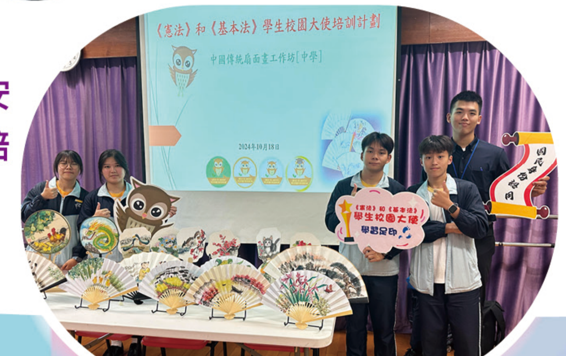
《憲法》和《基本法》學生校園大使培訓計劃——中國傳統扇面畫工作坊

本校透過多元化的課程及活動，包括品德教育、價值教育、公民教育、國家安全教育、環境保育、義工服務、文化交流活動等，期望在不同的學習歷程當中，培育學生成為有修養的青年，懂得自愛愛人，建立正向的自我形象和正確的價值觀，培育學生成為理性和富責任感的良好公民。